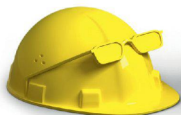
Planung & Ausführung