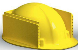
Fassaden & Boden