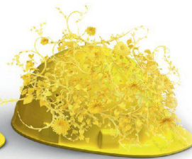
Nachhaltigkeit & Innovation

Auf die Erstellung hochkomplexer Klinker- und Sichtsteinfassaden haben wir unser Fundament gebaut. Dass wir visionär denken und entsprechend planen und realisieren, beweisen wir täglich in sämtlichen Bereichen unserer Geschäftsfelder. Wir schaffen Mehrwert, mit System am Bau: www.keller-ziegeleien.ch