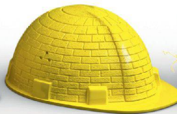
Mauerwerk & Bauteile