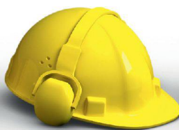
Innenausbau & Akustik