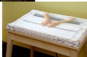
^ Videoinstallation «HandArbeit» von Evelina Cajacob. ^ Videoinstallazione di Evelina Cajacob «Lavoro a mano».