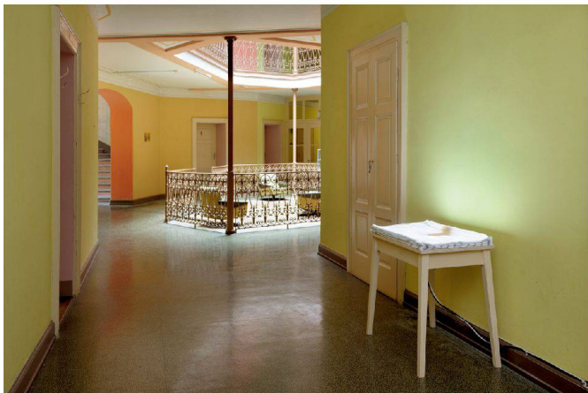
< Blick in den Lichthof des Hotels Bregaglia in den oberen Etagen. < Sguardo nel cortile a lucernario dell'hotel Bregaglia dai piani superiori.