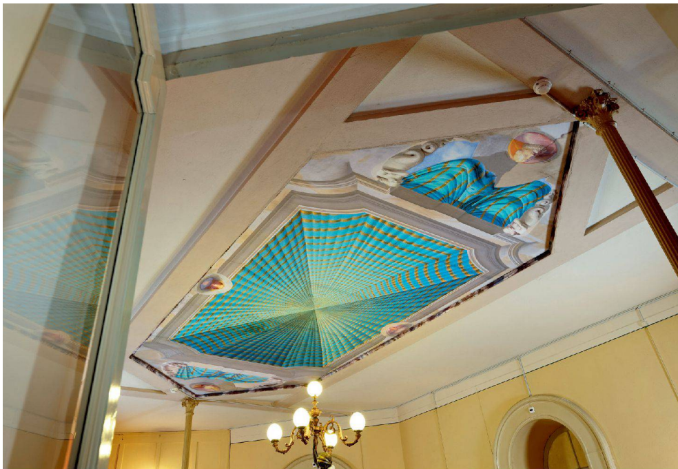
^ Jules Spinatsch hat im Parterre den früheren Lichthof mit einer Fotoinstallation «geöffnet». ^ Con una fotoinstallazione, Jules Spinatsch ha «riaperto» a pianterreno l'antico cortile a lucernario.