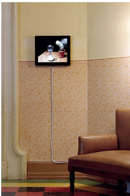
< Videoinstallation von Judith Albert. < Videoinstallazione di Judith Albert.