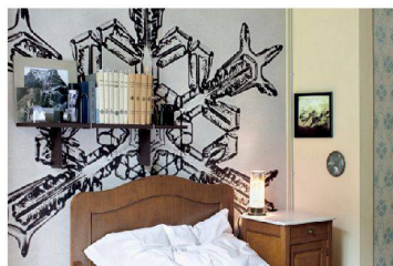
< Wandbild von Gaudenz Signorell. < Dipinto murale di Gaudenz Signorell.

schlägt einen langsameren Takt. Natürlich bringt die Aktion Leben, Abwechslung und auch Logiernächte ins Tal – fürs Hotel Bregaglia und für andere Häuser.» Das freut den Posthalter von Promontogno, weil die Besucher gerne Karten verschicken. Und das freut auch den Ladenbesitzer und den Müller neben dem Hotel, weil sie ihre lokalen Produkte gut verkaufen.