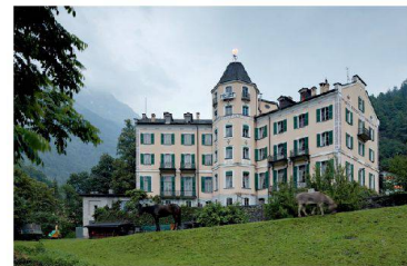
^ Ein Bau aus der Belle Époque – das Hotel Bregaglia als Ausstellungsort.