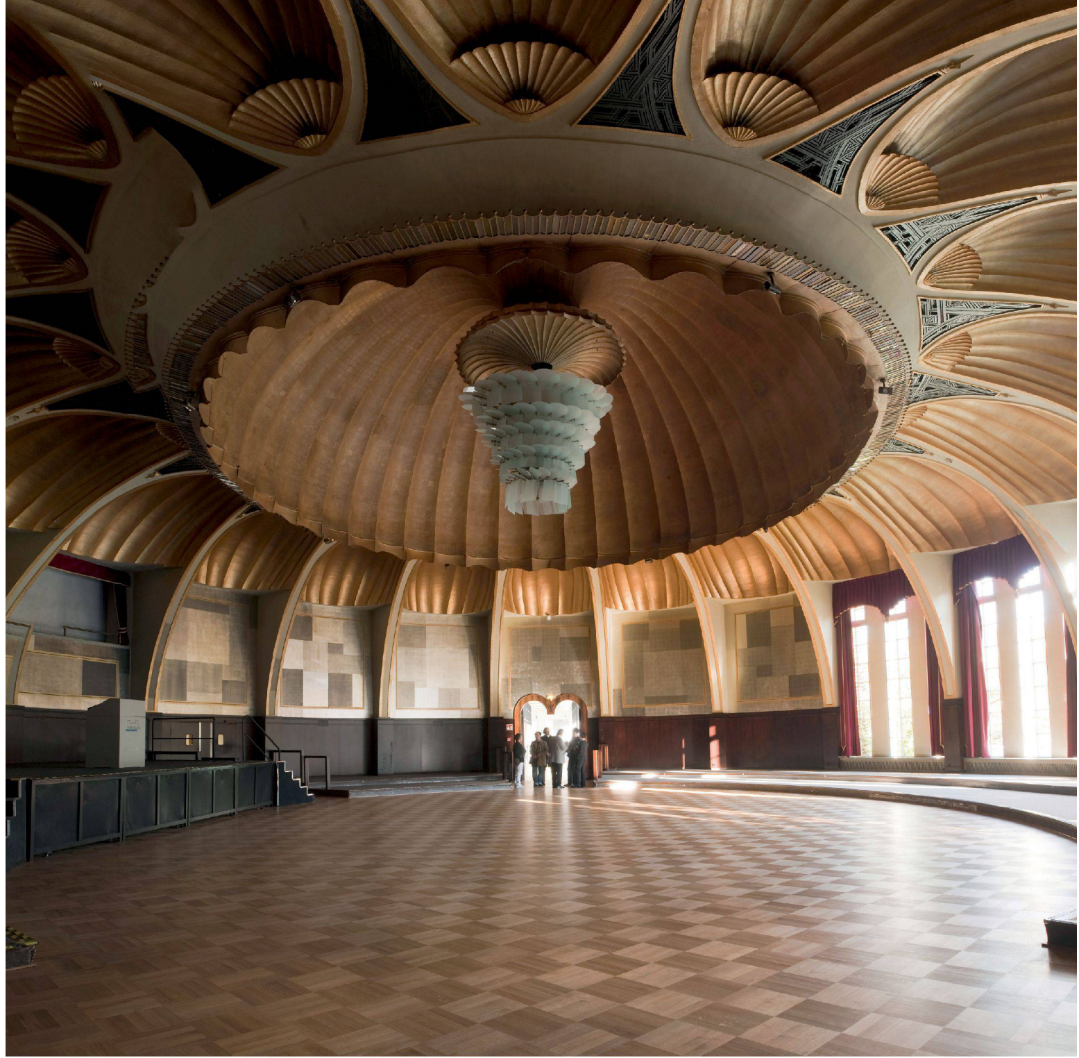
^Nach der Debatte: der Rheingoldsaal in Düsseldorf, 1926 von Wilhelm Kreis gebaut.