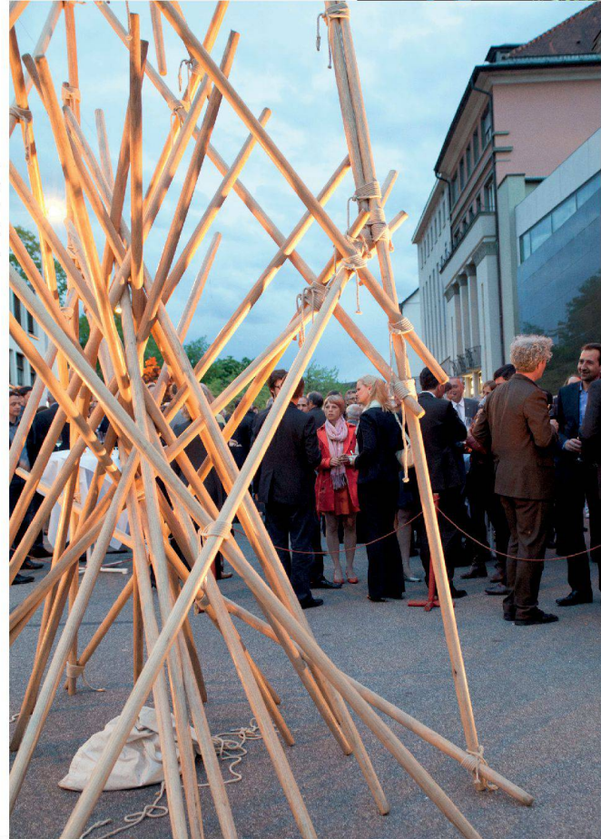
>Nach den Reden baute der Künstler Georg Traber seinen Himmelsturm langsam wieder ab.