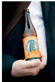
^Das Bier zum Fest: Die Etikette zeigt das SIA-Hochhaus.