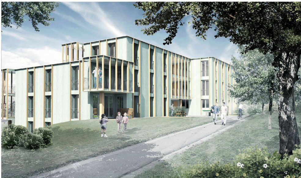
^Visualisierung des Neubaus, der die bestehenden beiden Wohnhäuser in Zürich-Seebach ersetzt.

sagt Wymann. So würden für bestimmte Aufgaben Pläne 1:500 genügen. Der Wettbewerb für die Ecole des Métiers in Fribourg etwa wurde in diesem Massstab juriert. «Von den Architekten wird oft zu viel verlangt», moniert der SIA-Wettbewerbschürer. Üblicherweise ist der Massstab 1:200 gefordert, die Stadt aber verlangte bei der Felsenrainstrasse 1:100-Pläne. «Dadurch hatten alle Teilnehmer erheblich höheren Aufwand als bei einem normalen Wettbewerb», stellt Architekt Rolf Mühlethaler fest.