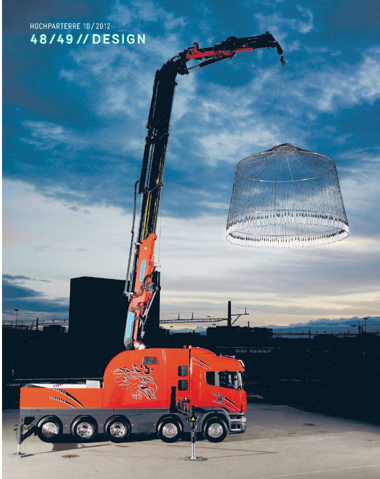
^Die Installation «Light Truck».

» BITTE BEGREIFEN Wie Midals Geschichte möchte auch die Ausstellung «Landscape» nicht elitär sein. Sie ist ein Versuch, den Leuten die Ehrfurcht zu nehmen vor dem, das sie vermeintlich nicht verstehen, weil es Autoredesign ist, und von dem, das sie nicht berühren dürfen, weil es sich im Museum befindet. Ist dieses Nischendasein aktuellen Designs – jenseits von dem, was im Möbelhaus zu finden ist – in der Schweiz eigentlich besonders ausgeprägt? Rovero kann nur für sich selbst antworten: «Ausschlaggebend ist, über welche Kanäle, wie, wo und wem etwas kommuniziert wird.» Dafür, dass Rovero zu den bekanntesten Schweizer Designern gehören sollte, kennen ihn hier wenige. Im Ausland berichtet die Presse öfter über ihn, dort bekommt er auch mehr Aufträge.