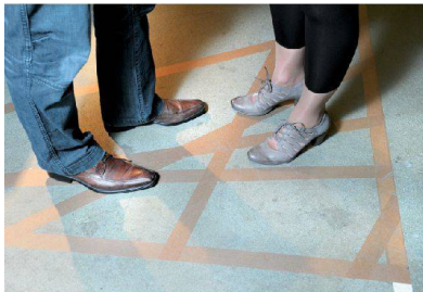
<In der Fabrikationshalle stehen für einmal schicke Schuhe.