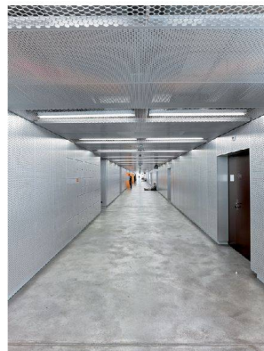
<Der Klassenzimmergang treibt die Länge des Gebäudes auf die Spitze.

Berufsfachschule, Freiburg HART, ABER WEICH