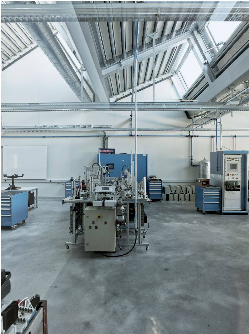
^In den Werkstätten liegt die Konstruktion der Sheddächer offen.