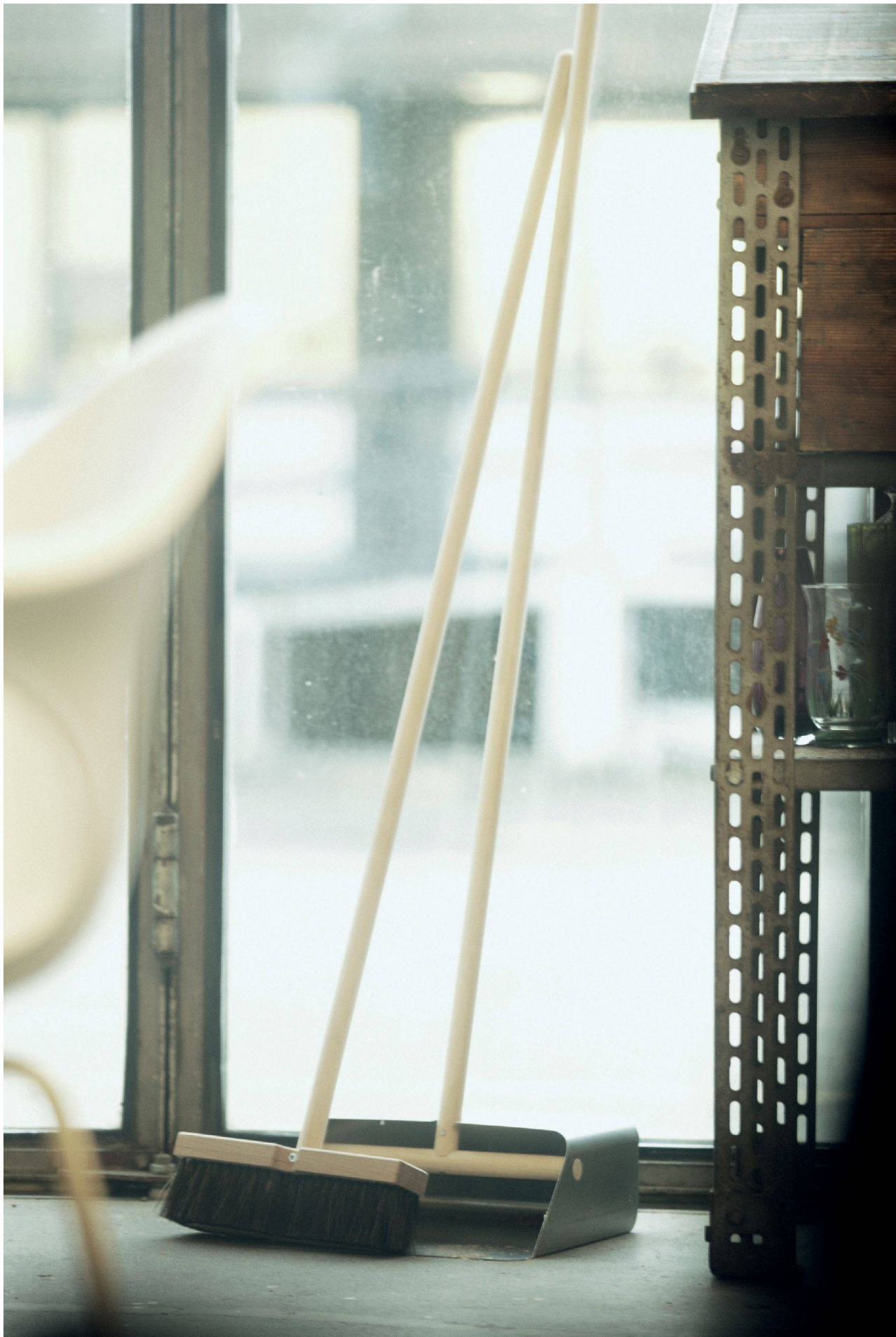
« Verleiht dem Velo und anderem einen Rahmen: «Shoes, Books, and a Bike» von Thomas Walde.