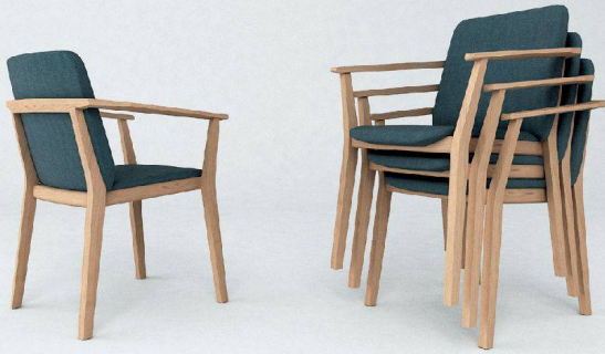
^Stapelbar und altersgerecht: Die überarbeitete Version kommt im September auf den Markt.

>> sie dem Pflegepersonal, wenn sie die Patienten im Stuhl an den Tisch schieben. Bei beiden Versionen hat Weber zusätzlich eine Griffmulde an der Unterseite der Rückenstrebe platziert.