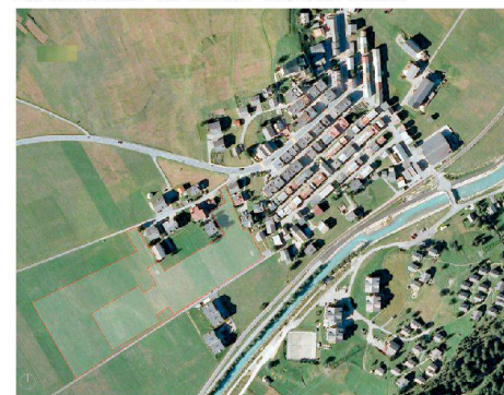
❷ Das Projekt «Goms Village» spinnt die Dorfstruktur der Walliser Gemeinde weiter.

BERATEN UND ENTWICKELN Die hier vorgestellten Projekte werden von Implen, Abteilung Modernisation & Development, entwickelt. Das Unternehmen berät Investoren, Betreiber sowie Besitzer von Immobilien, und es entwickelt neue Immobilienprojekte. > www.implen.com