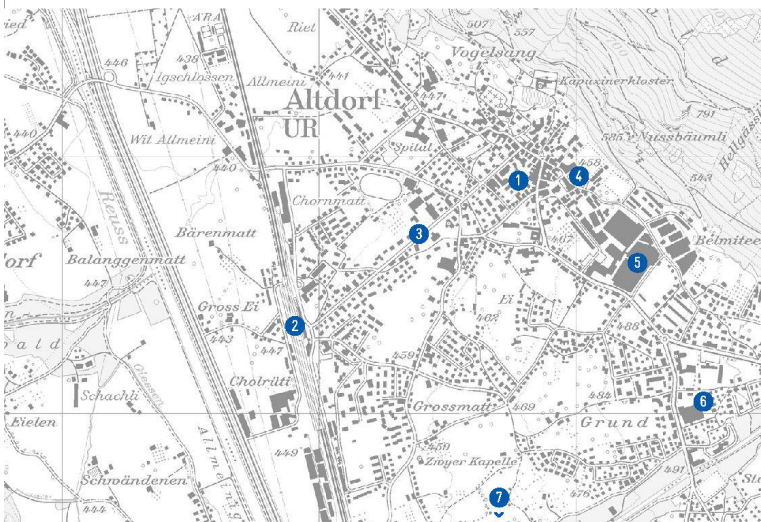
1 Altdorf Zentrum, 2 Bahnhof (Ausbau ab 2016), 3 Bahnhofstrasse, 4 Coop, 5 Dätwyler AG, 6 Einkaufszentrum Untertor (Migros), 7 Einkaufszentrum Tellpark, Schattdorf. Reproduziert mit Bewilligung von swisstopo (BA 130066).

Doch der heute noch in der Peripherie dahindösende Bahnhof hat dank der Neat durchaus Zukunft. Einiges deutet darauf hin, dass ab 2016 – mit der Eröffnung des Gotthardbasistunnels und später nach der Bahnumfahrung von Flüelen – Altdorf der einzige Bahnhof im Kanton Uri sein wird, an dem auch internationale Züge halten. Diese Aussichten haben die Urner Kantonsregierung schon 2007 dazu bewogen, ihn als «Kantonsbahnhof» zu adeln. Auch wenn es noch einige Jahre dauern wird, bis hier wirklich investiert wird, zeichnet sich die Aufwertung des Standorts rund um den Bahnhof schon ab. Zudem soll der Busbahnhof vom Telldenkmal dorthin »