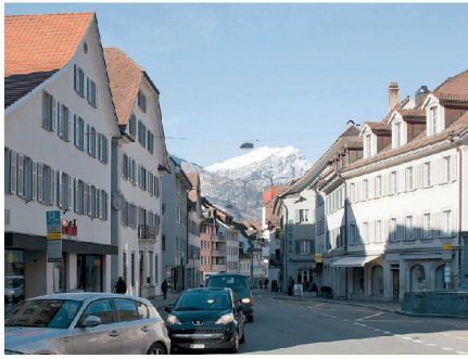
^... in der Tellsgasse und der Schmiedgasse rollt er und belebt die Geschäfte.