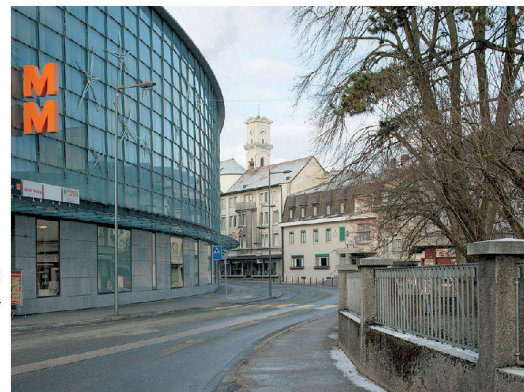
>An der Rue de la Maltière zeigt sich: Delémont hat seine Einkaufsriesen integriert.