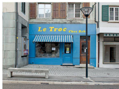
^...eine charmante und originelle Nahversorgung Platz.