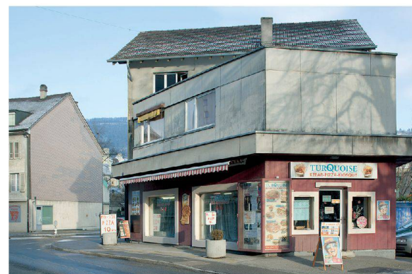
^ So manche Ecke, die sonst leer stünde, füllt die günstige Gastronomie – aber für wie lange?