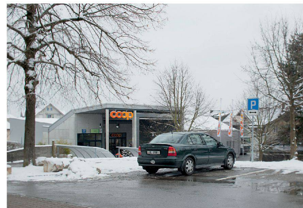
^ Metzgerei und Bäckereien im Städtli Wiedlisbach sind geschlossen. Doch das Bild täuscht. Einkufen ohne Auto ist möglich: Der Coop befindet sich direkt am Städtli-Rand.