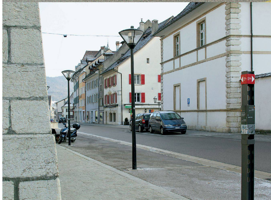
^Eigentümer haben begonnen, ihre Altstadt Häuser zu renovieren. Eine Folge der entschlossenen Planung von Delémont.