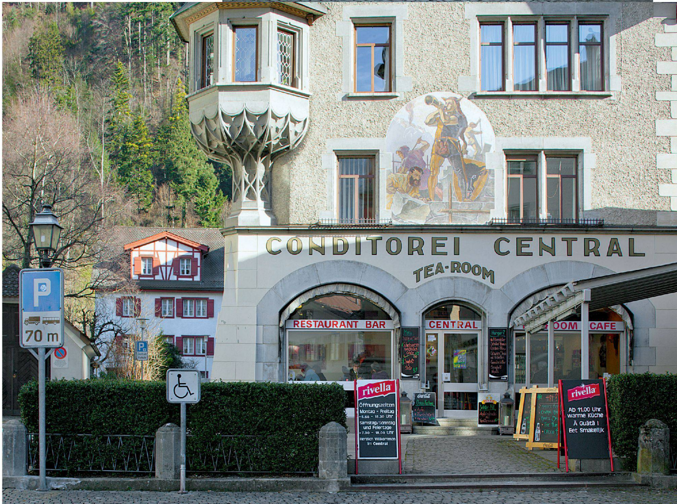
^Der Ortskern von Altdorf ist bis heute Treffpunkt, Esszimmer und Marktplatz der Neuigkeiten.

>Hier entsteht ab 2016 der neue Kantonsbahnhof. Wird er dem alten Zentrum die Luft abschnitten?