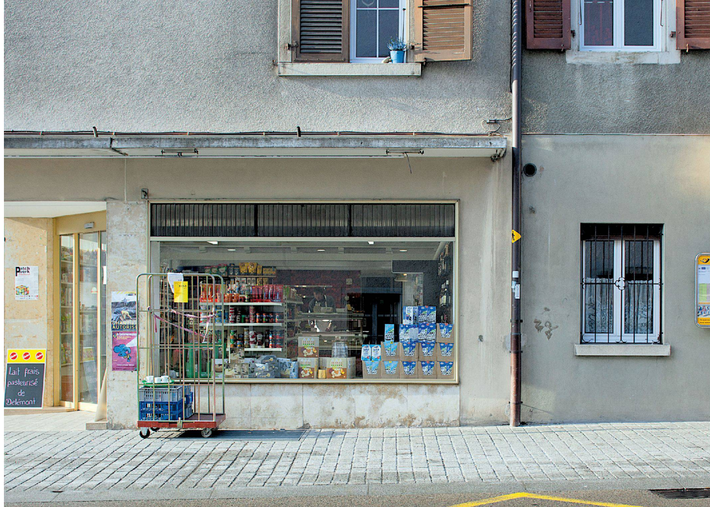
^Frische Milch aus dem Ort: In Delémont hat neben den Grossverteilern...