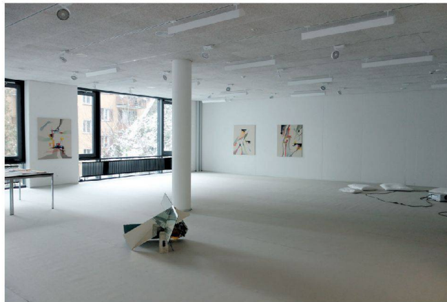
Baselstrasse 61 in Luzern: Noch sind die neuen Räume fast leer.