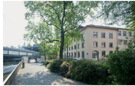
Die Sentimatt beherbergte einst die Schindler-Liftfabrik.

Arbeitsplätze für Textildesignerinnen und Textildesigner entstehen, die in Luzern ausgebildet wurden. Internationalisierung ist kein Schlagwort, sondern pure Notwendigkeit. «Wir müssen unsere Studentinnen und Studenten für den internationalen Markt fit machen. Die Textilindustrie ist heute in China, Indien, Brasilien.» Oder in Afrika, wie das aktuelle Projekt «Ankara, Air Condition & Co.» beweist.