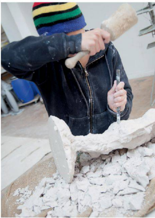
Material bearbeiten heisst Widerstände überwinden.