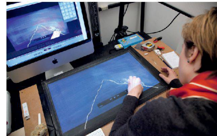
Der Computer, ein Werkzeug wie andere auch, will beherrscht sein.