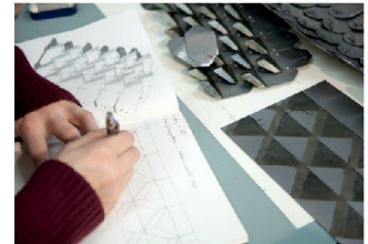
Digital Crafting erkundet digitale Entwurfs- und Produktionsprozesse.