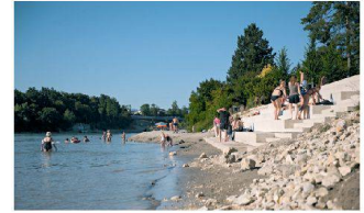
Stadtpark Ost, Rheinfelden AG Planikum