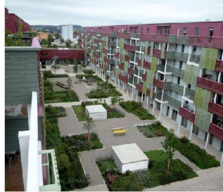
Hofgestaltung Mehrgenerationenhaus, Winterthur ZH Rotzler Krebs Partner