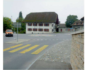
Ausbau Knoten Bären, Möriken AG SKK Landschaftsarchitekten