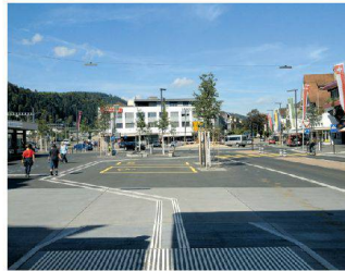
Neugestaltung Bahnhofgebiet Süd, Wattwil SG Rita Mettler Landschaftsarchitektur