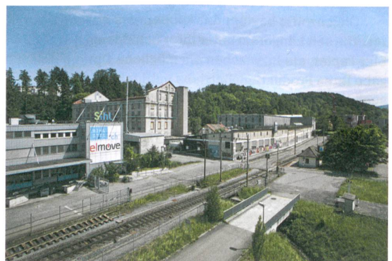
Die S-Bahn bringt Pendler in elf Minuten zum Hauptbahnhof Zürich.