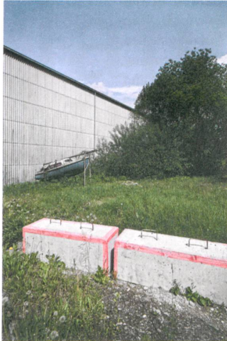
Das Wellblech weicht bald Neubauten.