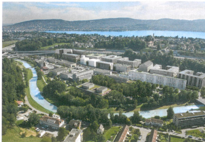
Greencity wird dicht und durchmischt.