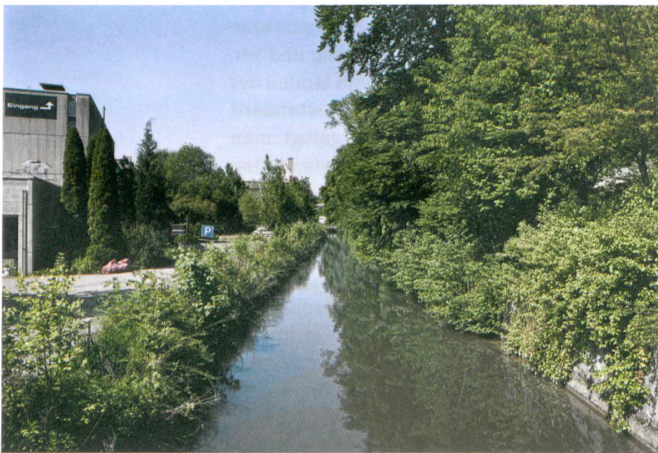
Harte Industrie, lauschige Natur: Neben dem Kanal wachsen Bäume.