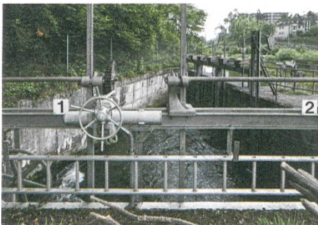
Der Kanal versorgt das Areal mit Strom.