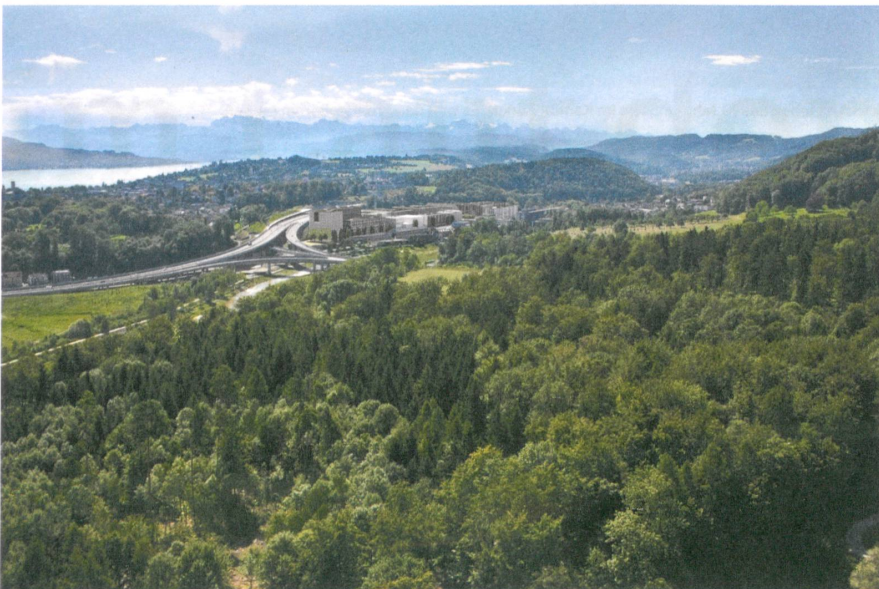
Viel Grün: Bewaldete Hügel umgeben die Manegg.

Text: Christina Gubler, Visualisierungen: Raumleiter, Fotos: Juliet Haller, Amt für Städtebau Zürich