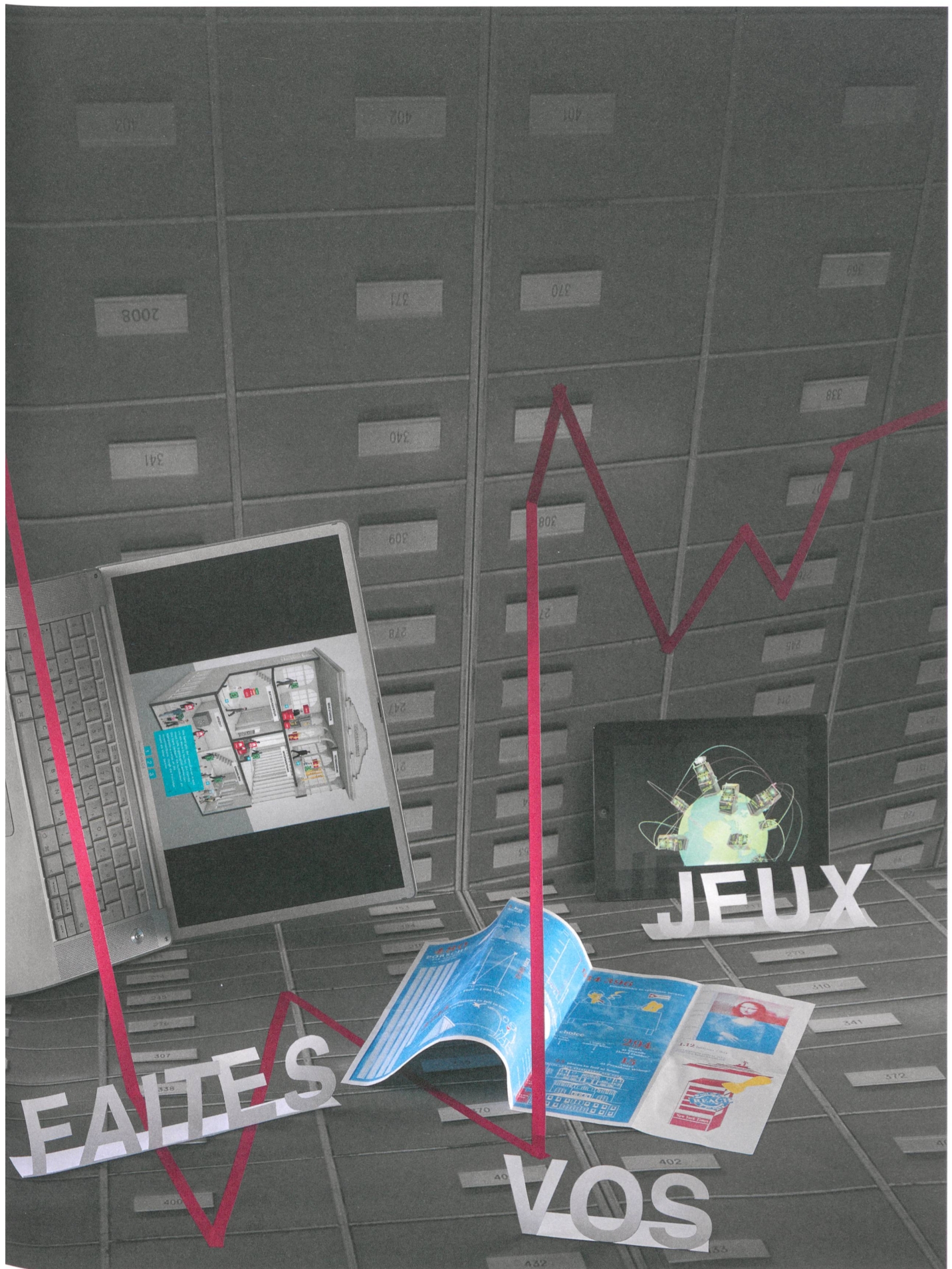
Wie visualisiert man die Finanzkrise und ihre Auswirkungen? Im Unterrichtsmodul «Faites vos jeux!» lernten Studierende, die inhaltliche Überforderung produktiv zu machen.