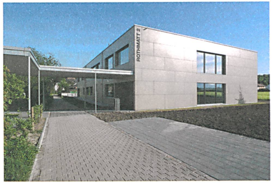
Das Ende der Baukultur? Neues Schulhaus in Rothrist.