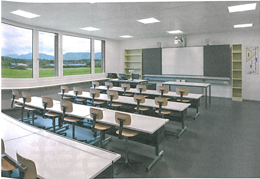
Klassenzimmer: Vom Holzbau ist nichts mehr zu sehen.