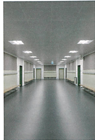
Der Korridor im Obergeschoss ist räumlich banal.