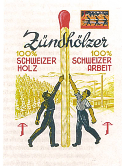
Seit 1938 gehört die Zündholzfabrik in Unterterzen zu HIAG.

Immer wieder ging HIAG geschickte Kooperationen ein. Ein besonders kluger Schachzug war, dass sie sich in den 1960er-Jahren von der österreichischen Doka die Schweizer Generalvertretung für deren äusserst erfolgreiches Betonschalungssystem sicherte. Die Betonschalungsbranche war ein noch junger Industriezweig, und mit Doka – die Schweizer Vertretung hiess ab 1983 Holzco-Doka – hatte HIAG «einen Partner gefunden, der seine Marktstellung dank seines weltweiten Absatzmarktes, der Grossproduktion mit modernsten Maschinen, der konstant betriebenen Forschung und Entwicklung und des weltweiten Informations- und Erfahrungsaustausches (...) ständig ausbaute», wie 1997 an einer Medienkonferenz erläutert wurde. Im Zuge der Neuorientierung der HIAG ging die Generalvertretung vor einigen Jahren zurück an den Umdasch-Konzern, zu dem Doka gehört. →