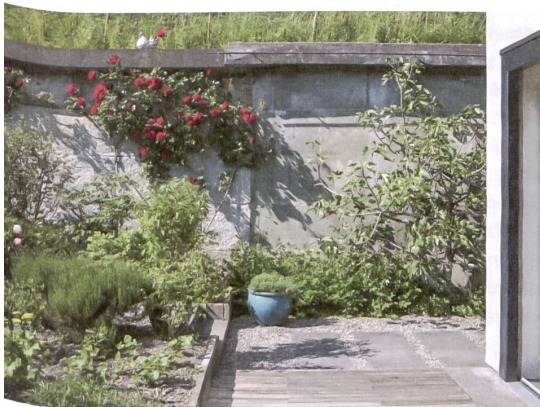
Der Garten bietet etwas Nahrung: Rhabarber, Kirschen, Küchenkräuter, seit Kurzem auch Beeren und Feigen.