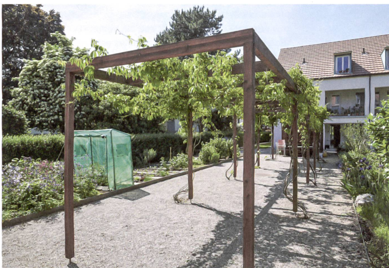
Vielfältige Nutzungsmöglichkeiten im klaren Raster.

Die Siedlung, die sich in die kleinteilige Umgebung einfügt, besteht aus zwei parallel angeordneten, zweistöckigen Gebäudezeilen mit ausgebautem Dachgeschoss. Die Riegel sind spiegelbildlich in den geräumigen Innenhof orientiert. Zusammen mit den breiten, wohnlich eingerichteten Laubengängen, die über einen Lift bequem auch in die oberen Wohnungen führen, begünstigen sie tägliche Kontakte und zufällige Begegnungen. Ist in einer der Wohnungen der Rollladen einmal nicht hochgezogen, wird nachgeschaut. An den äusseren Flanken der beiden