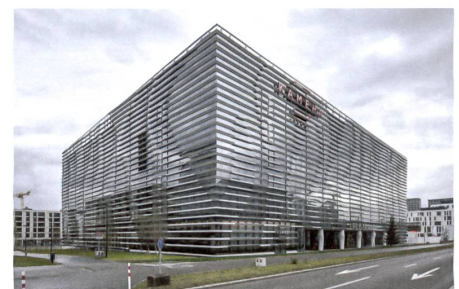
25 Hotel «Kameha Grand Zürich»