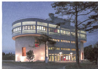
1 ARA Glatt, «Bilden + Begegnen»

Seit 2001 wird das Abwasser von Zürich Nord in dieser Kläranlage nicht mehr gereinigt, sondern nur noch gesammelt und durch einen Stollen in die Anlage Werdhölzli geleitet. Die Gebäude hat man zu einem Seminarzentrum umgebaut. Adresse: Orionstrasse 165 Bauherrschaft: Stadt Zürich, ERZ Architektur: Schockguyan Architekten, Zürich Kosten: Fr. 10,8 Mio.