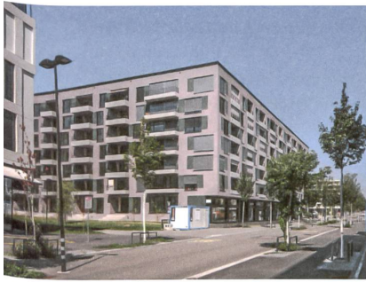
28 «Jardin Dufaux»

Betonrahmen, doppelgeschossige Rücksprünge sowie die eingezogenen Loggien prägen den dunklen Baukörper. Adresse: Boulevard Lillienthal 41–51, Wright-Strasse 31–33 Bauherrschafft: MFH Projekte, Schaffhausen Architektur: Bürohochform, Gisler Holliger Architekten, Zürich Generalunternehmung: Halter AG, Gesamtleistungen, Zürich