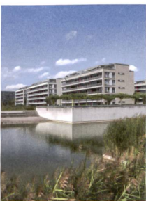
14-16 <An der Promenade>, <Seepark Glattpark> und <Lematt> v.r.n.l.