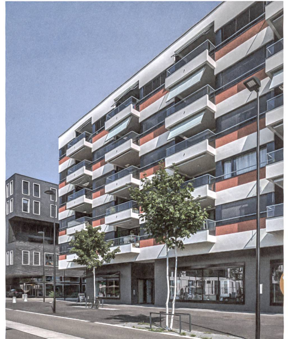
20, 21 «Wright House»