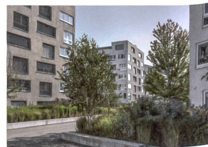
9 Wohnsiedlung «Glattbach»

Plangrundlage: Amtliche Vermessung Stadt Opfikon (Gossweiler Ingenieure)