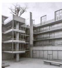
32 «Min Max», Modell

26 Glattpark Mitte, 2015 Der u-förmige Baukörper öffnet sich gegen den ruhigen Hof. An der Fassade bilden Sichtbetonelemente einen Raster, der verglast oder mit gefaltetem Streckmetall gefüllt ist. Die 110 Mietwohnungen sind vom Hof her erschlossen. Adresse: Boulevard Lillienthal 31–45 Bauherrschafft: Ant. Bonomo's Erben Immobilien, Zürich Architektur: Think Architecture, Zürich Landschaftsarchitektur: Rosenmayr Landschaftsarchitektur, Zürich Generalunternehmung: C. Vanoli Generalunternehmung, Immensee Kosten: Fr. 35 Mio. (BKP 2) Auftragsart: Studienauftrag