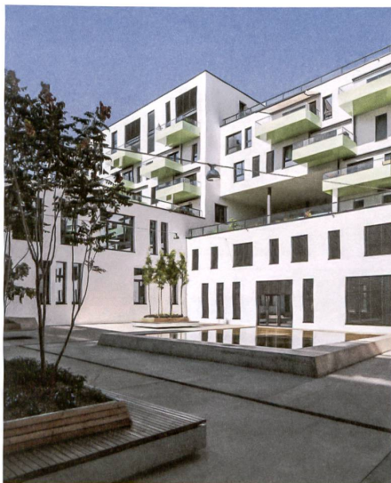
17 <Wright Place>