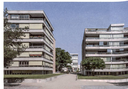
4-6 «Wohnen am See», «Seeblick» und «Frontwave» v.l.n.r.

Plangrundlage: Amtliche Vermessung Stadt Opfikon (Gossweiler Ingenieure)