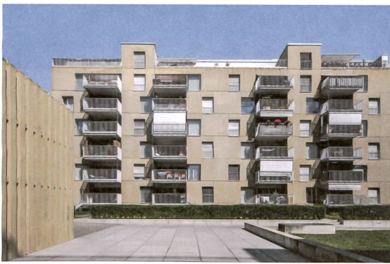
10 Überbauung <Lilienthal>

gemeinsam durchgeführten Studienauftrag erreicht, den das Architekturbüro von Ballmoos Krucker für sich entscheiden konnte.