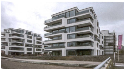
31 «Hamilton View»

Das siebengeschossige Hotel steht an der Strasse von Oerlikon zum Flughafen. Horizontale Metalllamellen gliedern die Glasfassade gleichmässig in Streifen. Dahinter liegen 245 Zimmer, Kongress- und Konferenzräume sowie Bars und mehrere Restaurants. Adresse: Dufaux-Strasse 1 Bauherrschafft: Turintra AG, vertreten durch UBS Fund Management (Switzerland) AG, Basel Projektentwickler: Mettler2Invest, Zürich Architektur: Tec Architecture Swiss, Ermatingen Landschaftsarchitektur: Nipkow Landschaftsarchitektur, Zürich