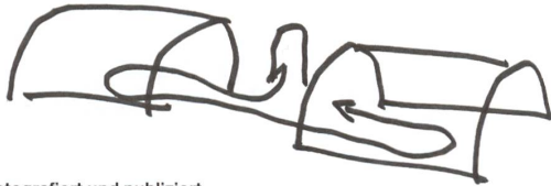
Jasper Morrison fotografiert und publiziert auf Instagram, was ihm ins Auge springt. Geht es darum, etwas zu erklären, greift er zum Stift. Etwa die räumliche Situation der Retrospektiven in Belgien oben und in der Schweiz unten.

Seine Beschränkung auf einen Ort und dessen Atmosphäre ist faszinierend.