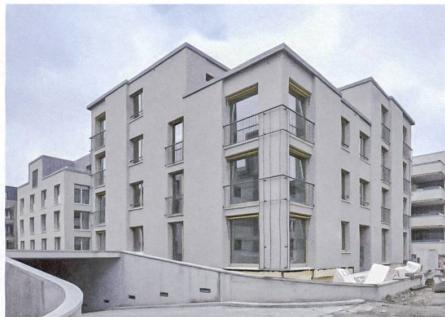
Grauer Kratzputz, gelbe Markisen und plastische Feinheiten prägen das schlichte Äussere.