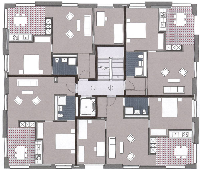
Grundriss Regelgeschoss: Die gefliesten Bäder und Küchen wirken wie Intarsien in der ansonsten rohen Materialisierung.