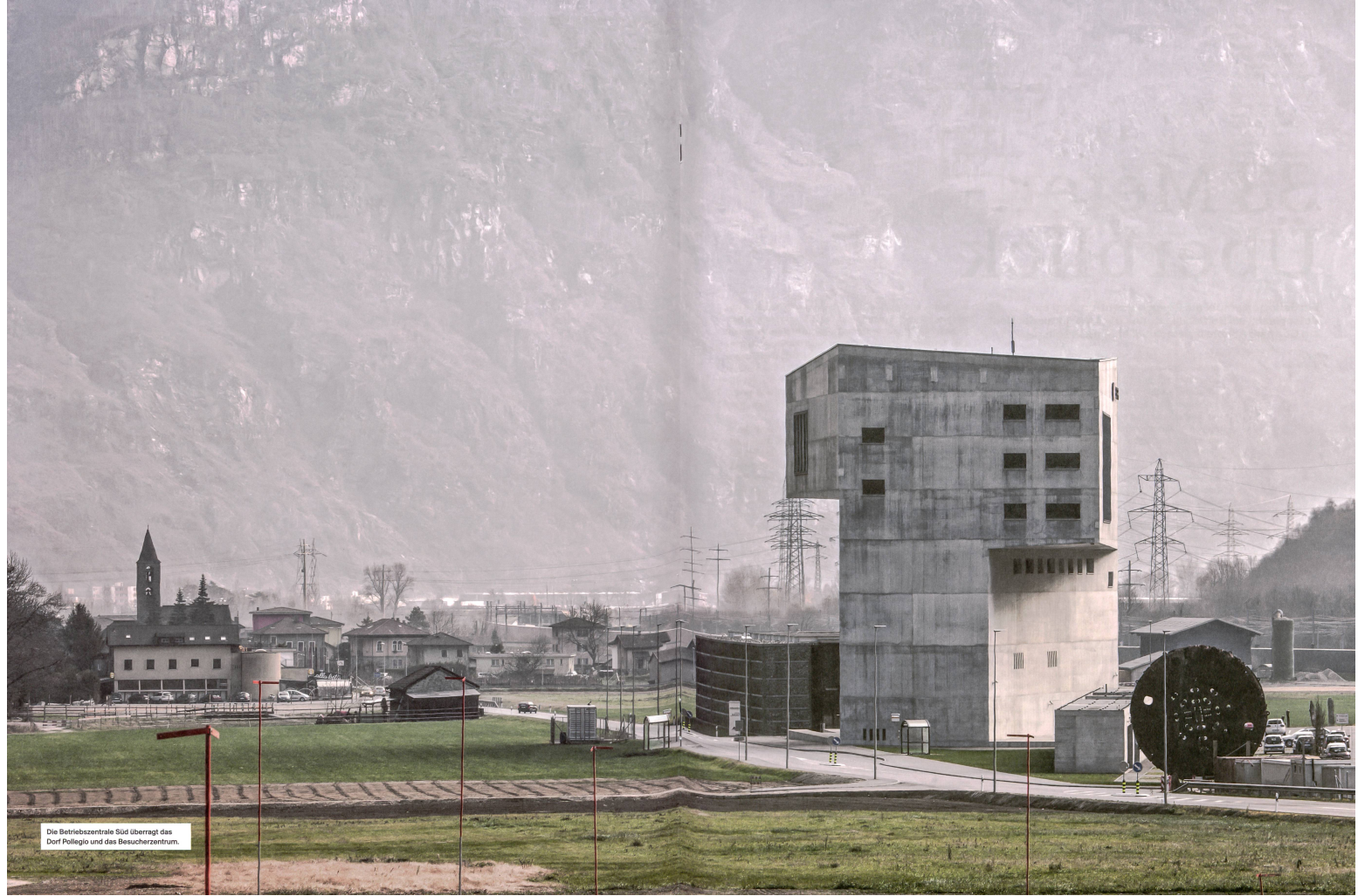
Die Betriebszentrale Süd überragt das Dorf Pollegio und das Besucherzentrum.