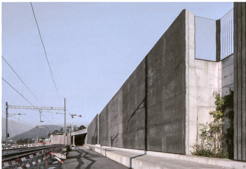
Kräftige Stützmauern mit Blicknischen prägen das Südportal des Ceneri-Basistunnels bei Vezia.

Wie sieht das Tessin 2050 aus? Führt die Flachbahn, günstiger, weil kürzer, nach Varese, oder führt sie, teurer, aber richtig, über Chiasso nach Mailand? Fahren täglich Hunderte von Personen- und Güterzügen durch Bellinzona oder ist die Umfahrung Bellinzona gebaut? Kommt zur «Direttissima» gar die «Stazione Ticino» als zentraler Verkehrsknoten der «Città Ticino»? Zwischen den Beinen der Viadukte scheint manches möglich. Sie stehen als Zeichen für Gestalt und Ordnung in der Magadinoebene, die als Fallbeispiel für Zersiedelung bekannt ist. Wunderbar paradox, wie die starken Bauten nun ausgerechnet hier einen Zukunftstraum vorbereiten. ●