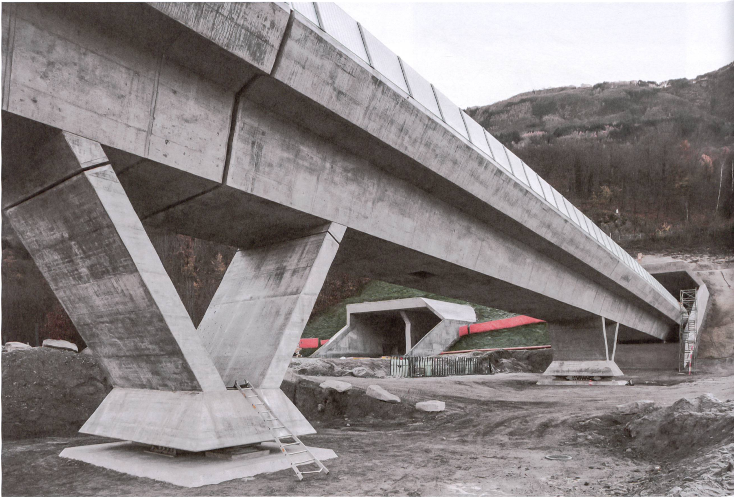
Kräftige Beine: Die V-Stützen des Viadukts bilden mit der Brückenplatte ein kraftschlüssiges Dreieck wider die Bremslast der Züge und verkürzen die Spannweite.