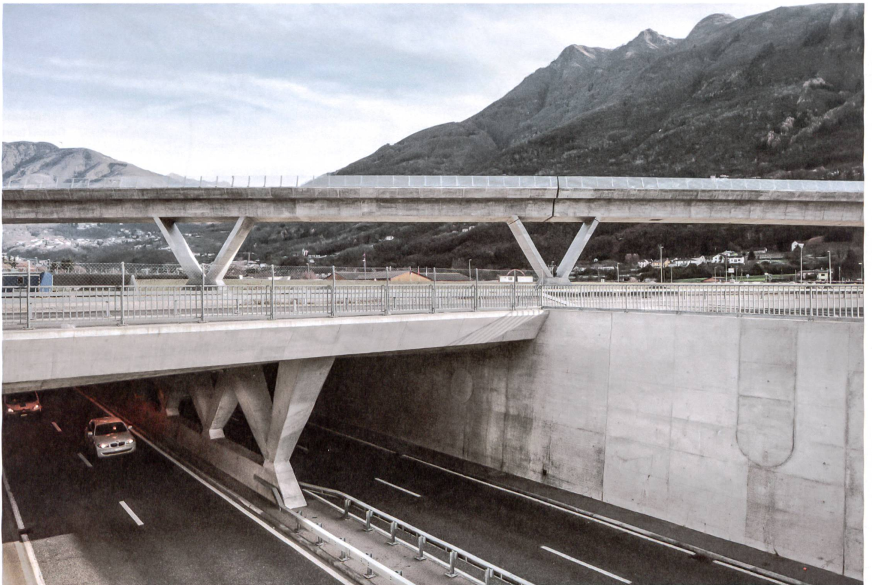
Kohärente Formen: Bei Camorino bezieht sich die aufgelöste Mittelwand der Kantonsstrassenunterführung erkennbar auf die Stützen des Viadukts.