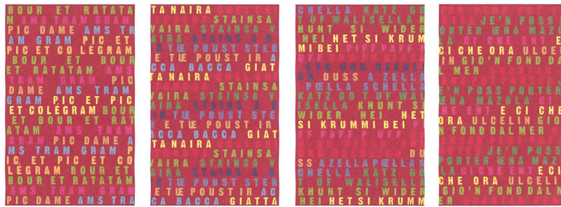
Farbentwurf des «allover» für die vier Säulen im Foyer des Quaderschulhauses in Chur mit Abzählreimen in je einem Dialekt der vier Sprachregionen der Schweiz.