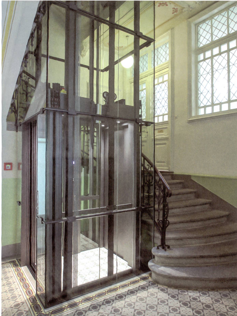
Präzis fügt sich der Lift ins historische Treppenauge.

Dem Himmel entgegen- sauen – das Loch in der Kabinendecke korrespondiert mit dem Oberlicht im Treppenhaus.