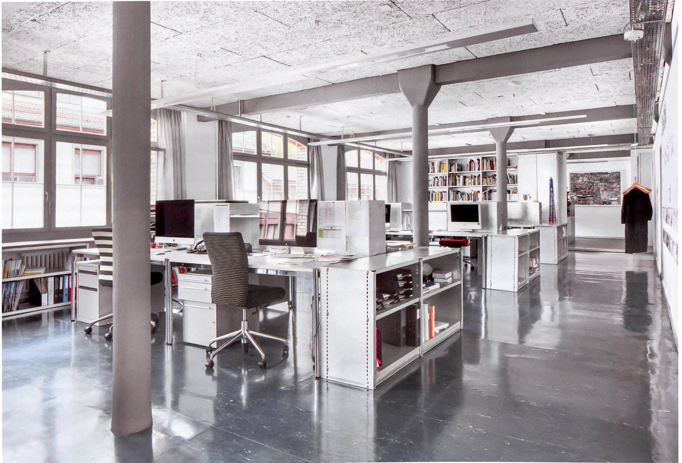
«Ausräumen» war die Devise bei Hochparterres Umbau an der Ausstellungsstrasse in Zürich. Zum bestehenden Mobiliar haben die Architekten einzig neue Tischmöbel entwickelt.