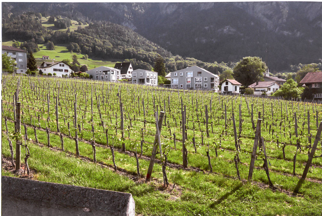
Privilegiertes Wohnen am Rand der Grünzone Markstaller 1. Sie ist knapp eine Hektare gross.

Gemeinde bewilligte Projekt gibt es Einsprachen. Der Bau werde der grösste Torkel im Dorf und bräuchte den Ausbau einer bestehenden Fahrspur zu einem 160 m langen Schotterrasenweg. Befürchtet wird auch eine künftige Nutzung als Gastwirtschaft. Die Einsprecher wollen, dass auch Winzer ihre Betriebe in Bau- und nicht in Grünzonen erweitern, was hier gut möglich wäre. Sie meinen, dass auch ein herausragender Architekt eine Grünzone schwäche, wenn in ihr gebaut werde.