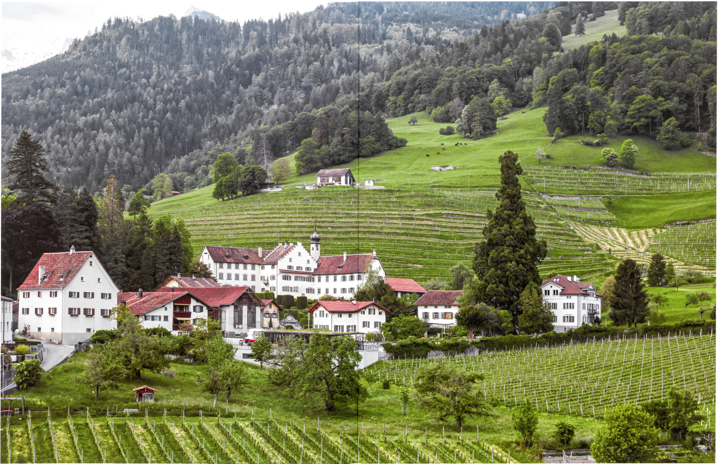
Schloss Bothmar, Sitz der Familie von Salis, in der Grünzone Iseppi 5. Vor dem Schloss liegt die 1,8 Hektaren grosse Grünzone Scadena 4.