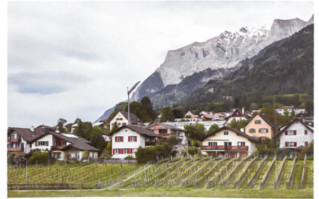
Kuona: Haus um Haus wird der Dorfrand befestigt.