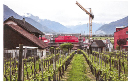
Unterdorf: Parzelle um Parzelle wird zugebaut.