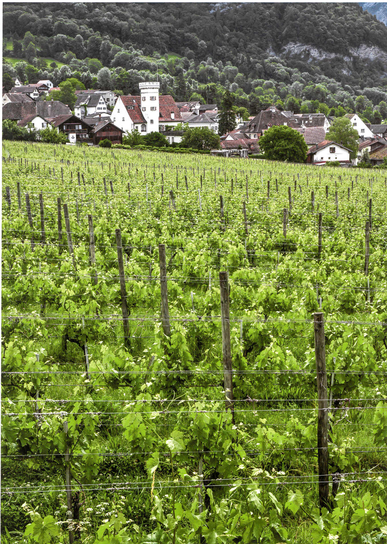
Küng und Ratschelga 2, angrenzend an die Kirche und umgeben von dichter Bebauung, ist mit vier Hektaren die grösste Grünzone und das landschaftliche Juwel von Malans.