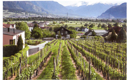
Törlweg: Verdichtungsdruck setzt Wingerten zu.