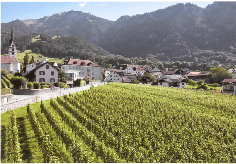
In der Bildmitte das grosse, graue Haus Schmid, rechts davon das Bäckerhaus mit Ställen. Die Grünzone Under Bongert 3 mit knapp einer Hektare ist der Weinberg dieses Ensembles.