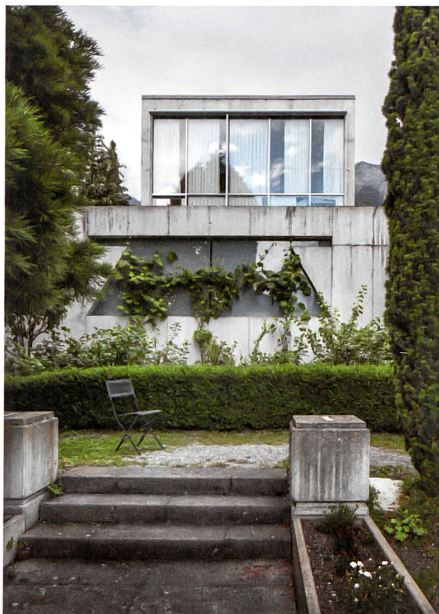
Das Haus des Künstlers, 1996 von Felix Held gebaut.