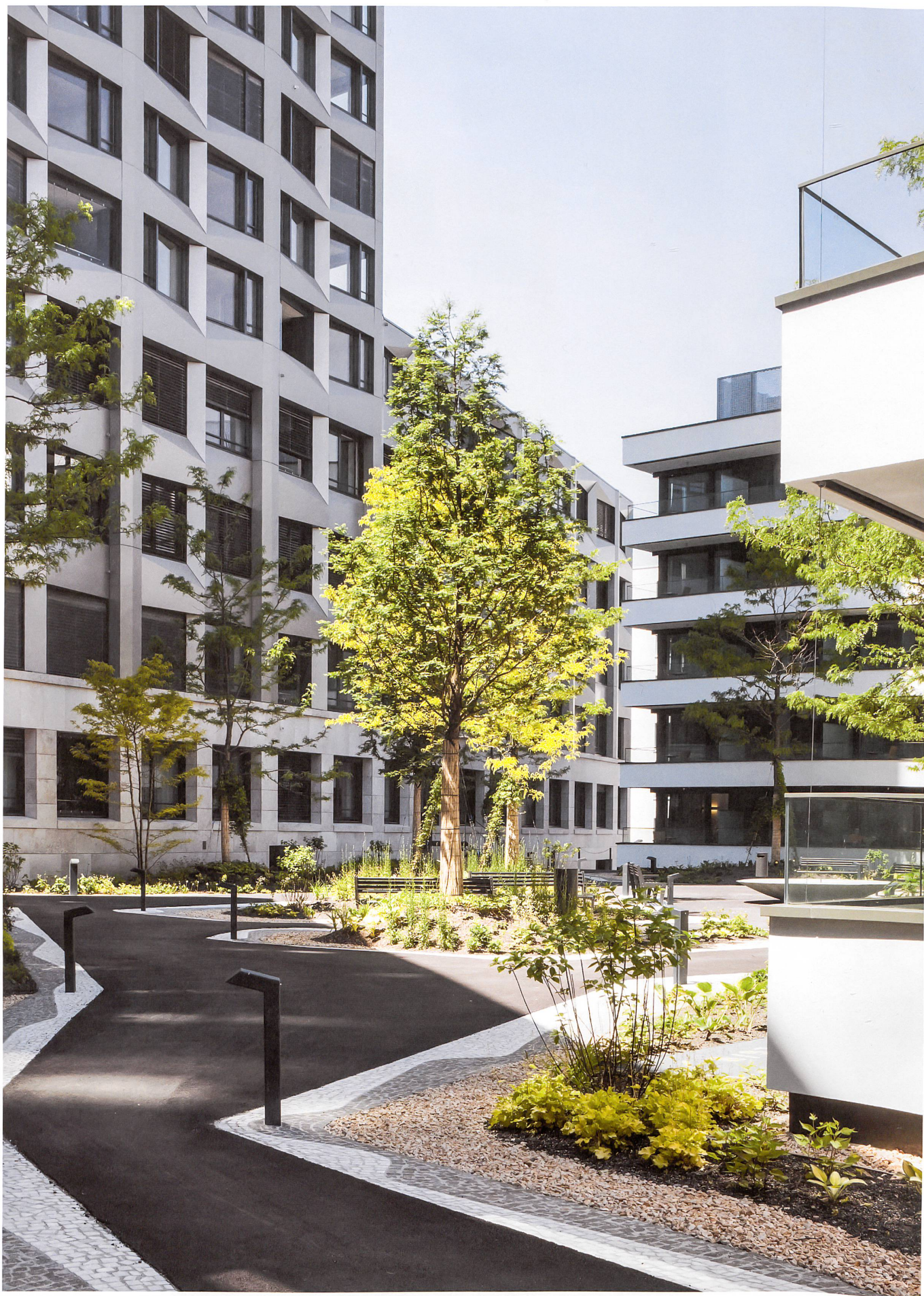
Ein Ort der Ruhe: Hinter den Bauten des Limmathofs liegt ein erhöhter, von allen Seiten zugänglicher Freiraum.