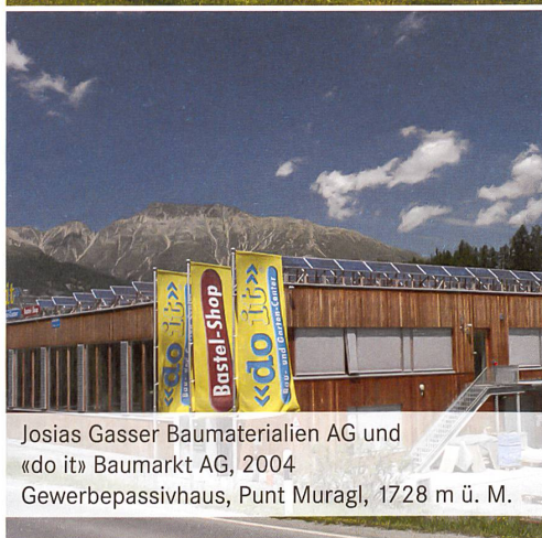
Josias Gasser Baumaterialien AG und «do it» Baumarkt AG, 2004 Gewerbepassivhaus, Punt Muragl, 1728 m ü. M.