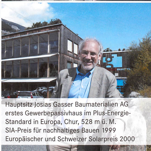
Hauptsitz Josias Gasser Baumaterialien AG erstes Gewerbepassivhaus im Plus-Energie- Standard in Europa, Chur, 528 m ü. M. SIA-Preis für nachhaltiges Bauen 1999 Europäischer und Schweizer Solarpreis 2000