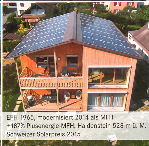
EFH 1965, modernisiert 2014 als MFH +187% Plusenergie-MFH, Haldenstein 528 m ü. M. Schweizer Solarpreis 2015