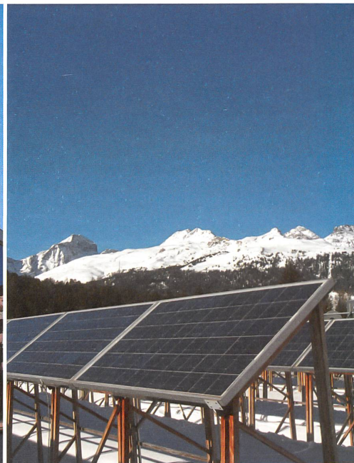
Solaranlage auf Holzständern Gewerbepassivhaus Josias Gasser Baumaterialien AG, 2004 Punt Muragl, 1728 m ü. M.