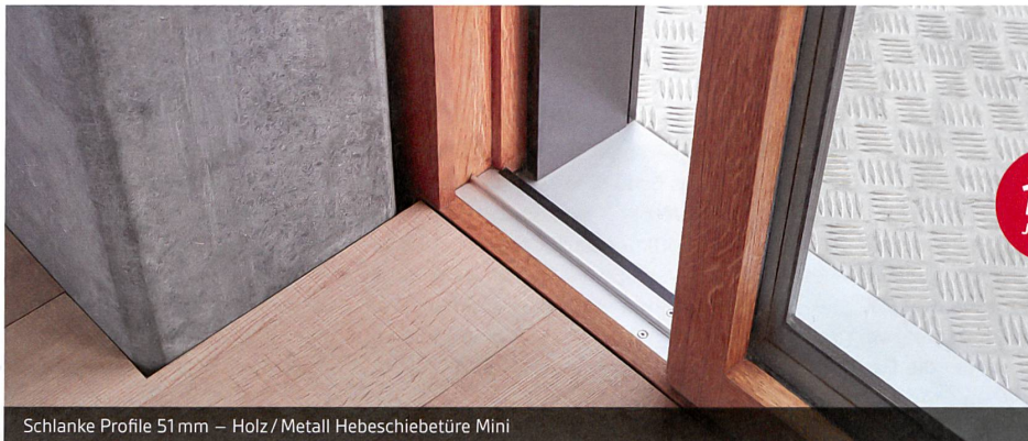
Schlanke Profile 51 mm – Holz/Metall Hebeschiebetüre Mini

Auf einem bisher privaten Grundstück des Iselin-Weber-Parks in Riehen plant der Architekt Peter Zumthor einen Erweiterungsbau für die Fondation Beyeler. Wie der Park wird das Haus öffentlich zugänglich sein. Bau und Inbetriebnahme sollen achtzig Millionen Franken kosten. →