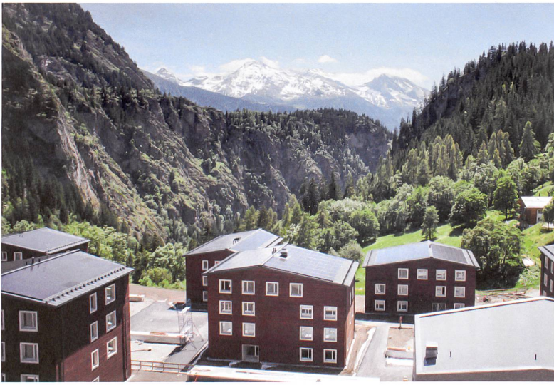
Sonne, Erdspeicher und Abwasserwärme liefern für die fünfzig Wohnungen und das Hallenbad der Reka-Siedlung in Blatten achtzig Prozent der Energie. Projekt: Lauber Iwisa