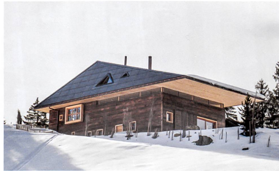
Für das Wohnhaus Sieber in Sörenberg produziert die Sonne viermal mehr Energie, als das Haus braucht. Projekt: Scheitlin Syfrig Architekten