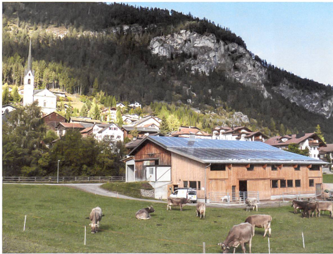
Das Solarkraftwerk auf dem Stall der Familie Negrini in Alvaneu produziert Strom für 14 Haushalte. Projekt: Solarspar