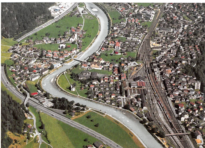
Erstfeld aus der Luft: In der Urner «Energistadt» werden auch viele Solardächer gebaut.