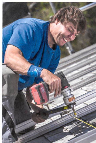
Solaranlagen werden meist von A bis Z selbst aufgebaut.