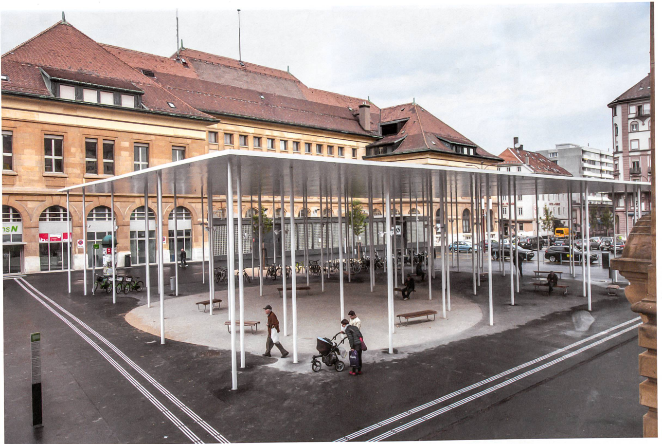
Das kleinere Dach ist den Fussgängern vorbehalten, die darunter auf zwölf Bänken ausruhen können.