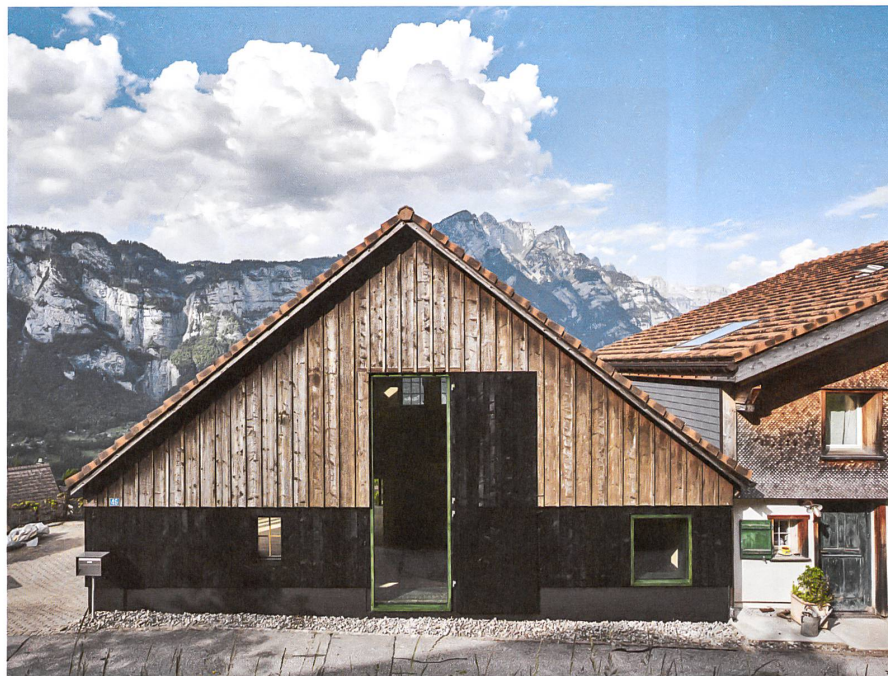
Aus dem Stall in Obstalden über dem Walensee wurde ein Ferienhaus und nun ein Wohnhaus.