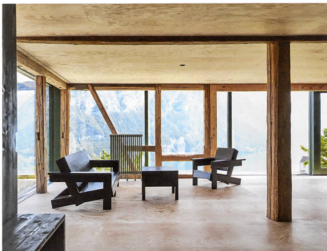
Ein Fensterband öffnet den niedrigen Raum wuchtig zur Aussicht.