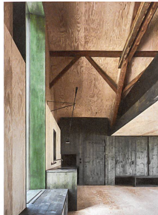
Über der Küche ragt der Raum bis unters Dach auf.