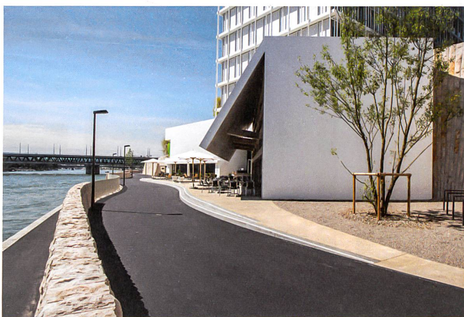
Oben ist der Weg hochwassersicher und nachts beleuchtet. Unten verläuft die Promenade direkt am Wasser.