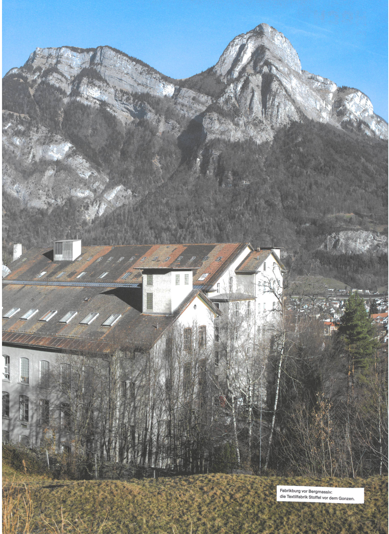
Fabrikburg vor Bergmassiv: die Textilfabrik Stoffel vor dem Gonzen.