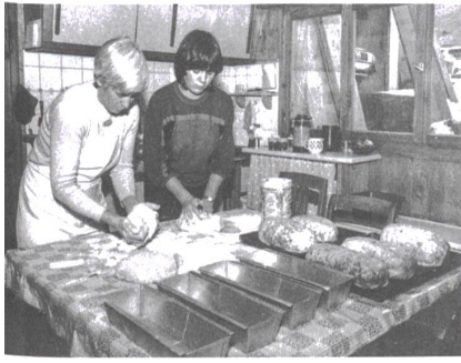
Bei der Zubereitung von Birnbrot im Prättigau (1980er-Jahre).