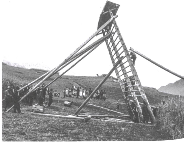
Aufrichten einer Kornhiste in Mompé-Tujetsch (1938).