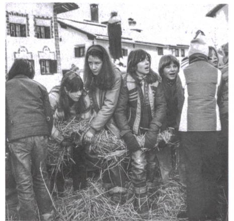
«Hom strom» in Scuol. Das Stroh wird unter Gesang der Jugend gedreht und geflochten, um eine feste Strohuppe herstellen zu können (1980er-Jahre).