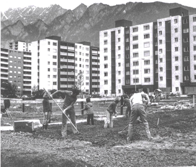
Arbeit in den Schrebergärten im Frühling in Chur (1980er-Jahre).