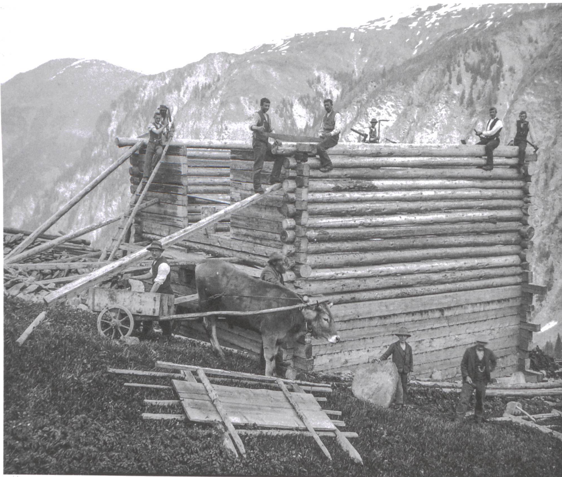
Bau eines Stalls in Safien Camana (1930er-Jahre).