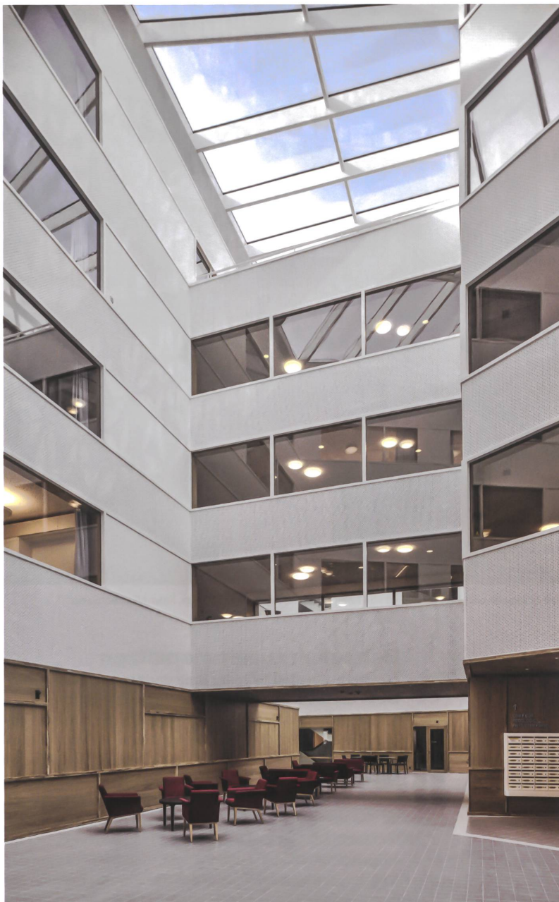
Beim Alterszentrum Obere Mühle in Lenzburg definieren Oliv Brunner Volk Architekten den Innenraum zugleich als Aussenraum.