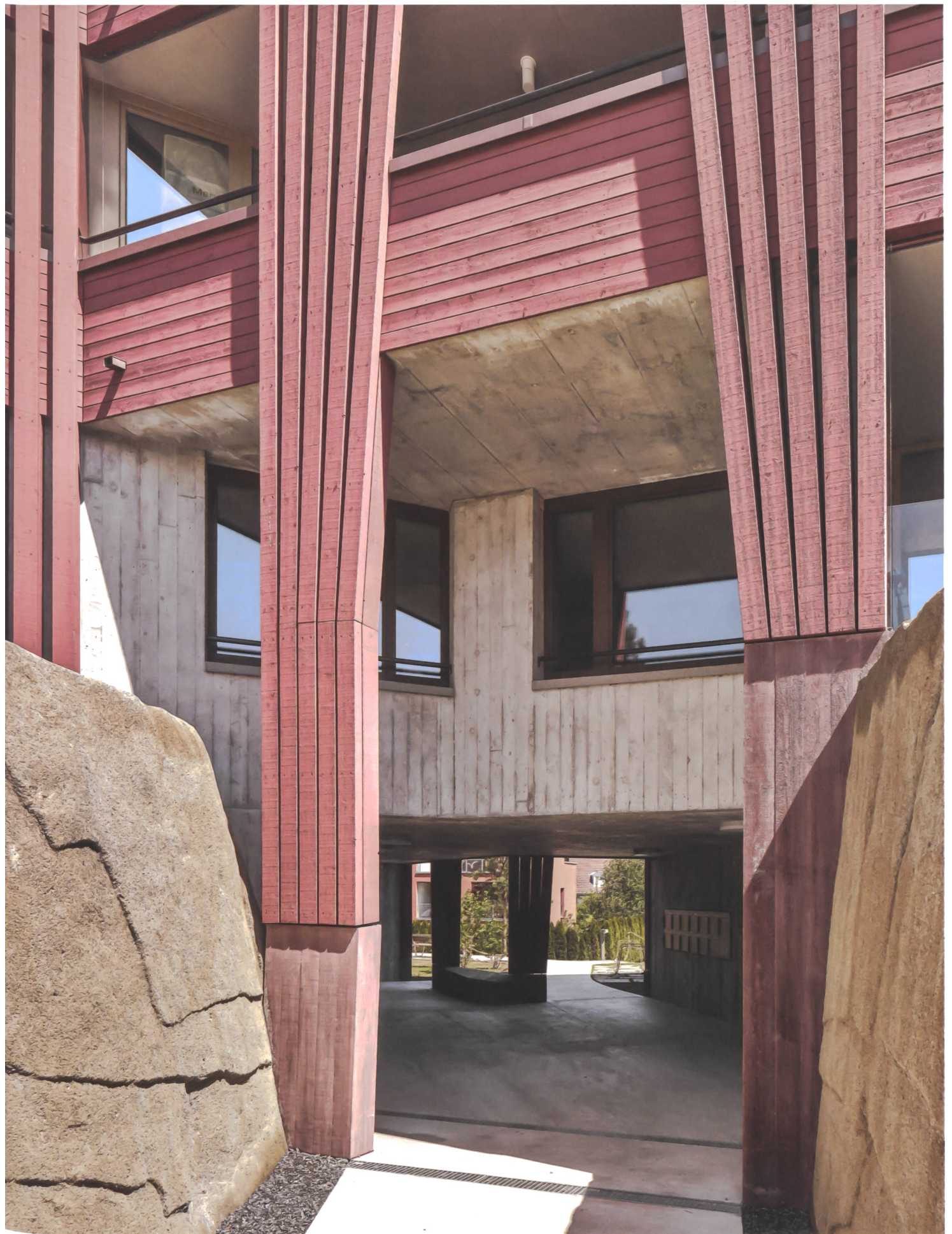
Neudorfstrasse in Wädenswil: Zwischen unbeholfenen Kunstfelsen führt der Weg zur Gebäudedetaille, die Fassade zieht sich wie ein Vorhang zur Seite.