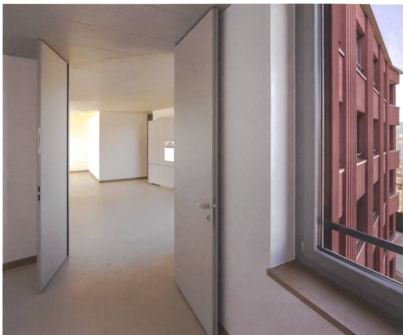
Fliessende Wohnraumfolge: Wie private Inseln liegen die Zimmer im Meer des Kollektiven.