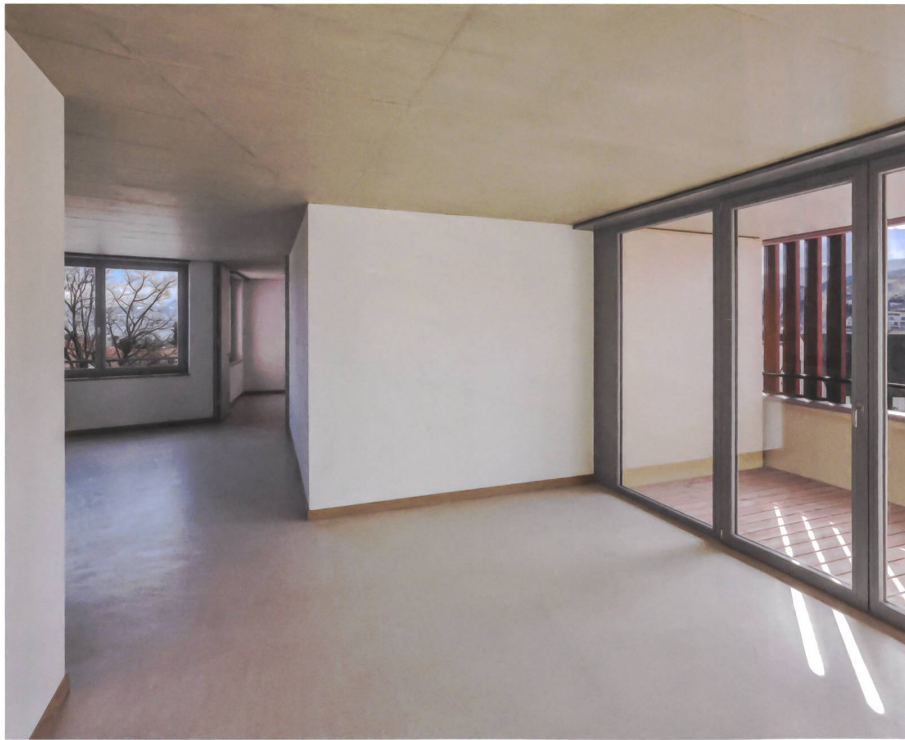
Die verwinkelten Grundrisse ermöglichen mehrseitigen Ausblick, Blickbezüge und lassen die Wohnungen grösser scheinen als sie sind.