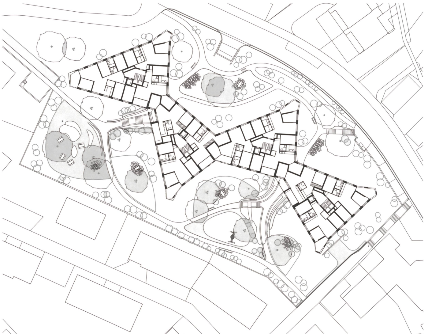
Erdgeschoss und Umgebung: Geschlungene Wege zonieren den Freiraum und erschliessen den Baukörper an den schmalen Taillen.