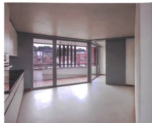
Schiebetüren machen das Zimmer zur Wohnraumerweiterung.