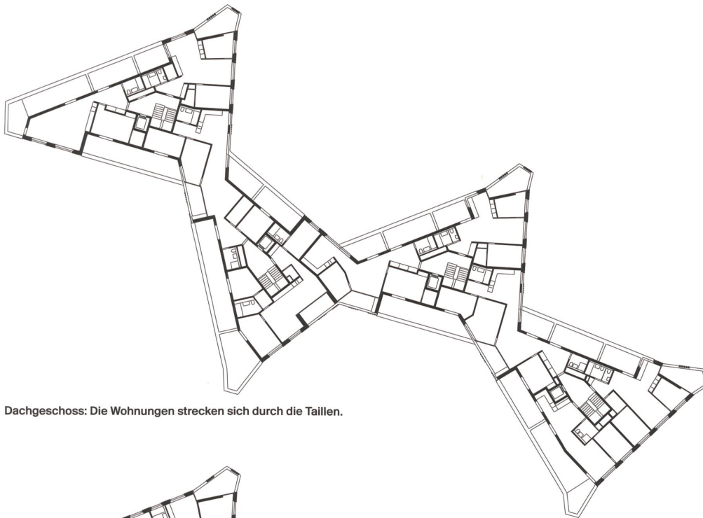
Dachgeschoss: Die Wohnungen strecken sich durch die Taillen.