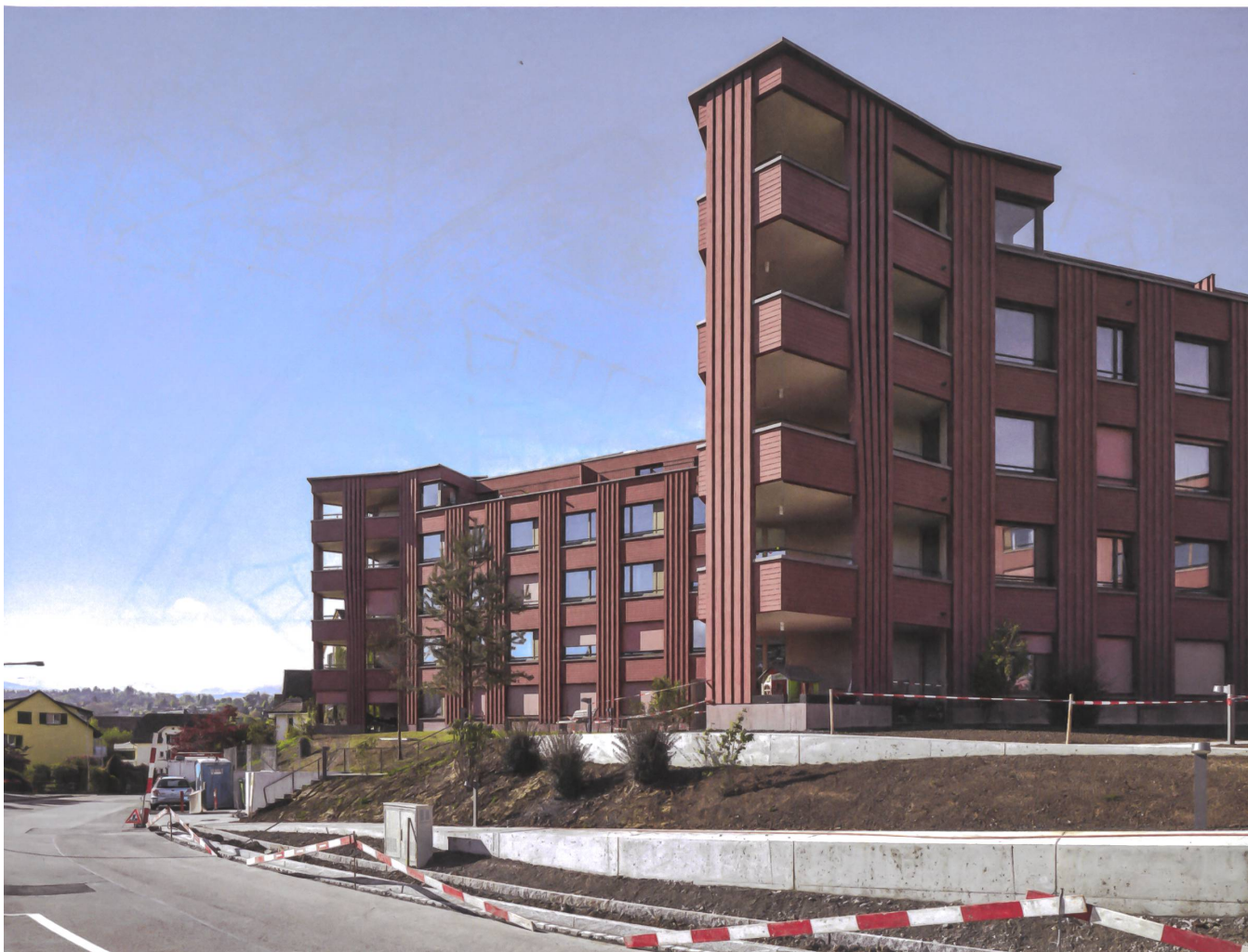
Das zergliederte Volumen fächert sich der Strasse entlang auf und scheint kleiner, als es ist.

→ hölzernen Hülle. Nun bildet ein Relief aus vertikalen, kräftig profilierten Streifen und zurückversetzten, glatten Horizontalflächen die Fassadenhaut. Das hinterlüftete Holzwerk aus Fichte ist in dunklem Falunrot lasiert, einer mineralischen Dickschicht mit Eisenoxid-Pigmenten, bekannt von schwedischen Holzhäusern. Sie haftet hervorragend auf sägerohem Holz, ist schädlingsresistent und kontrastiert mit der grünen Umgebung.