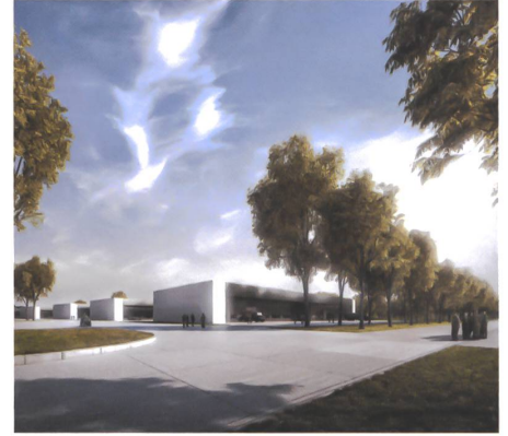
2 Mischnutzung Kaserne Auenfeld, Baumschlager Eberle Architekten.