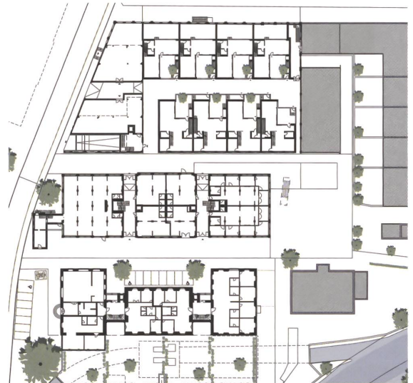
3 Überbauung Walzmühle, Grundriss Erdgeschoss.

bildet die Militärstrasse, die sich mit der Haubitzenstrasse kreuzt und dort einen zentralen Platz ausbildet. Daran liegen das bestehende ovale Kommandogebäude, das aufgestockt wird, und ein neues, liches Versorgungszentrum, das an die Stelle des bisherigen tritt. Ein medizinisches Zentrum und zusätzliche Unterkunftsgebäude ergänzen die bestehenden Versorgungsbauten östlich der Quartierachse. Westlich davon befinden sich die Ausbildungshallen, das Lagergebäude und ein Werkhof.