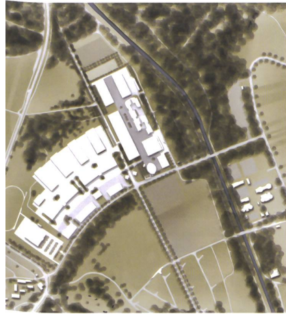
2 Mischnutzung Kaserne Auenfeld.