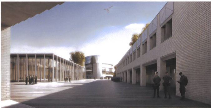
2 Mischnutzung Kaserne Auenfeld.