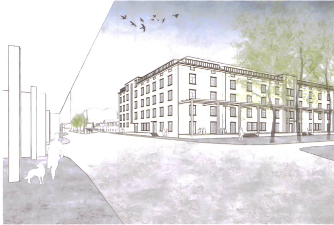
1 Stadtkaserne und Oberes Mätteli.