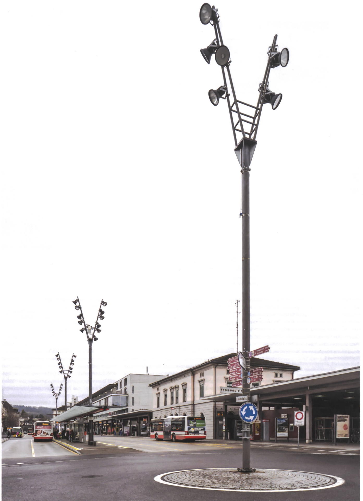
Reist man mit der Bahn nach Frauenfeld, ist der Bahnhofplatz das Entrée.