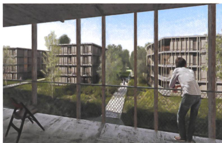
6 Wohnsiedlung Lindenweg, Stutz Bolt Partner Architekten.