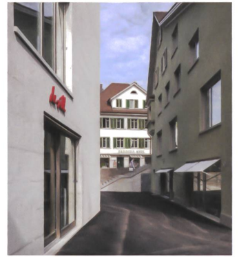
4 Wohn- und Gewerbehäuser zur Bleiche.