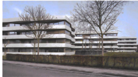
3 Parksiedlung Talacker, Ackermann Architekt.