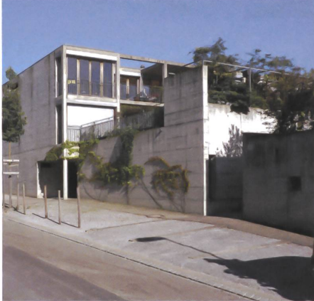
1 Stadthäuser im Algisser, Antoniol + Huber + Partner.