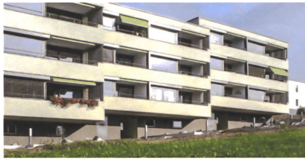
2 Erneuerung Wohnüberbauung Teuchelwies, Harder Spreyermann Architekten.