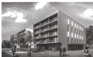
7 Wohnüberbauung Murgareal, Burkhalter Sumi Architekten.

wendet sich von den benachbarten Sportplätzen ab und blickt zum Stadtgarten. Zwischen den Bauten entsteht ein geschützter Aussenraum etwa für Demenzpatienten. Auch Besucherinnen der Cafeteria geniessen weiterhin den Blick ins Grüne. Die Keramikplatten des Sockels und der Putz darüber verweisen auf den Bestand.