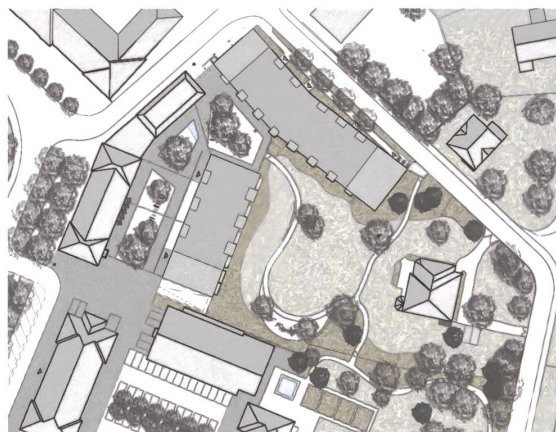
8 Wohnüberbauung Huberareal, Harder Spreyermann Architekten, Lageplan.