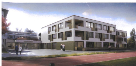
5 Erweiterung Pflegezentrum Stadtgarten, Allemann Bauer Eigenmann Architekten.