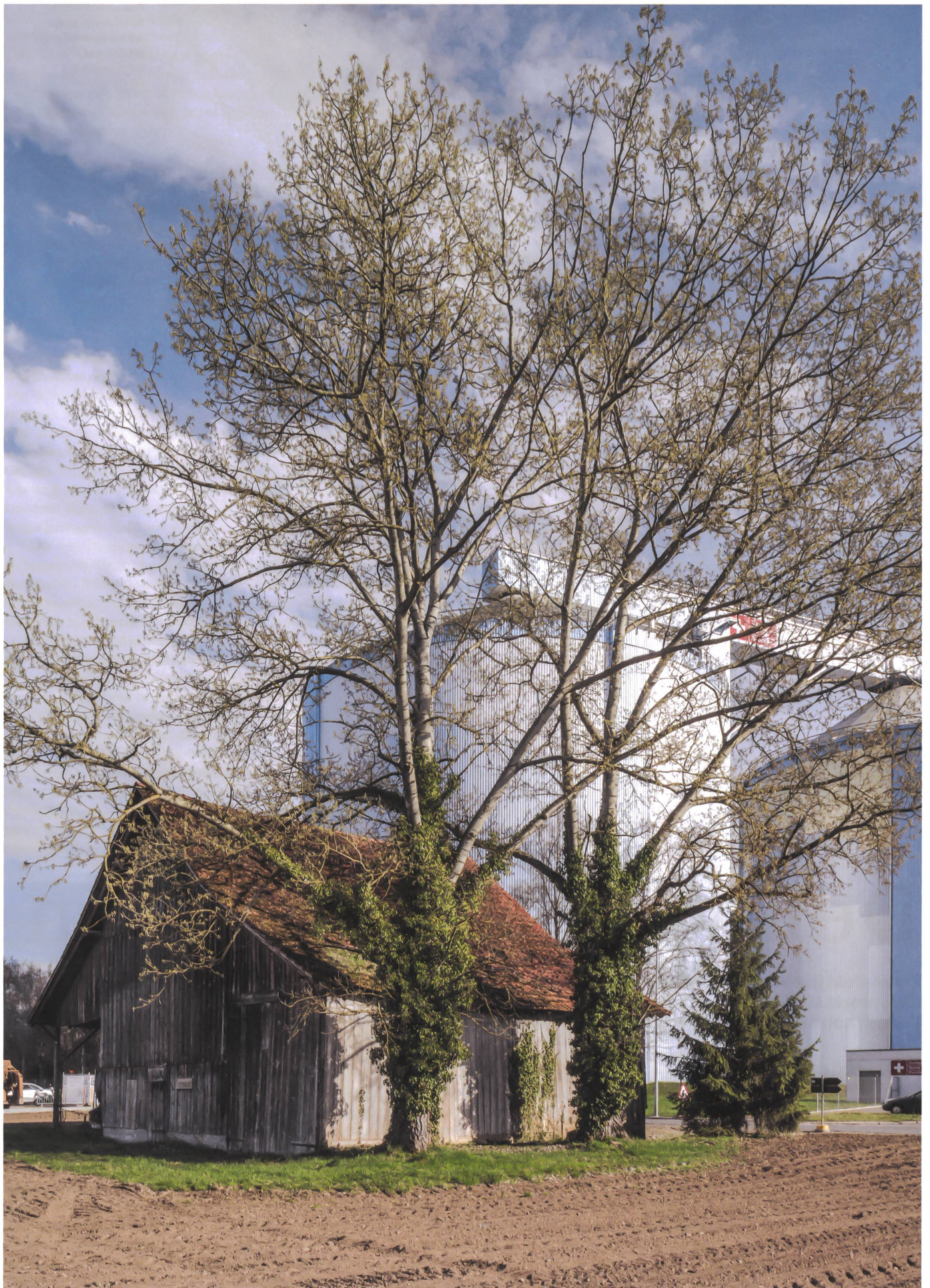
Beherrscht die westliche Ortseinfahrt: die Zuckerfabrik.