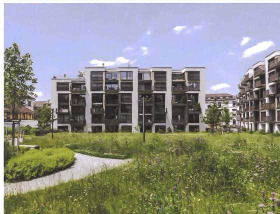
8 Wohnüberbauung Huberareal vom Park aus gesehen.