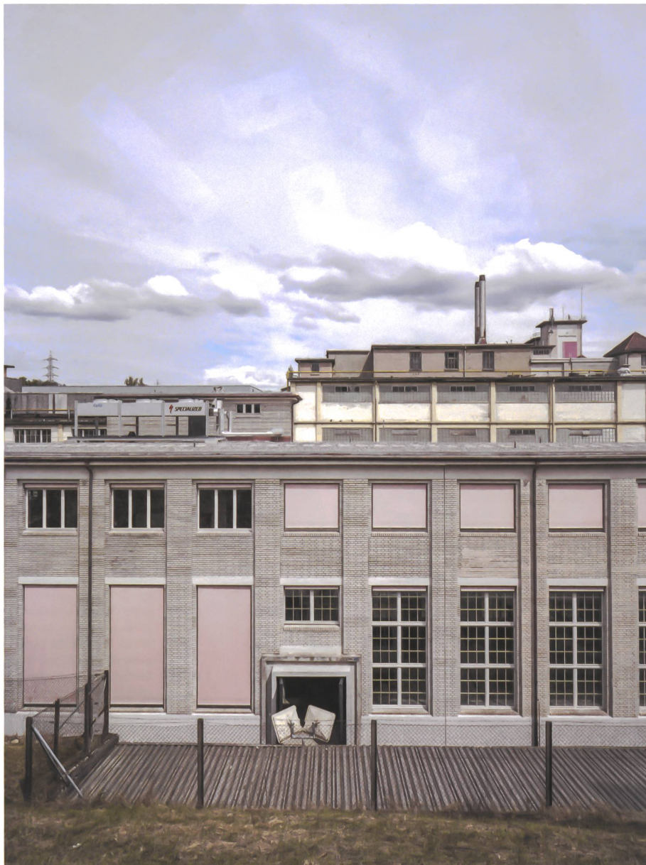
Umgenutztes Werkstattgebäude: Ein guter Anfang ist ein gutes Omen.