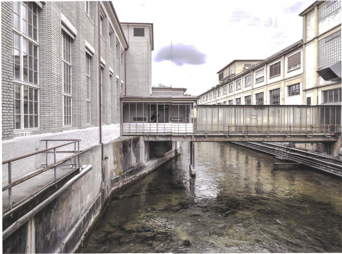
Mehr als 360 Jahre war die Lorze das Herz der Papierproduktion, künftig soll der Fluss das Herz eines lebendigen Quartiers sein.