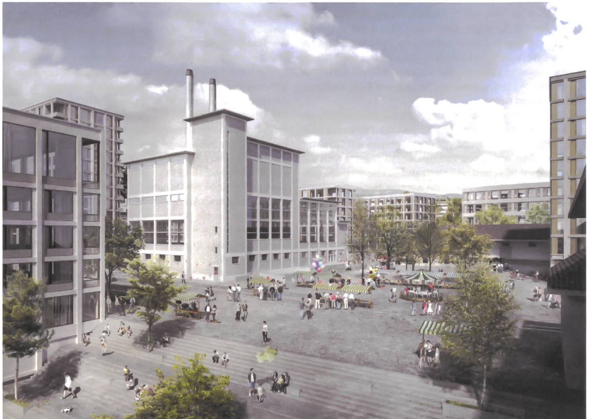
Der Kesselhausplatz und die grosse Freitreppe sollen das belebte Herz des Areals werden. Visualisierungen: Nightnurse