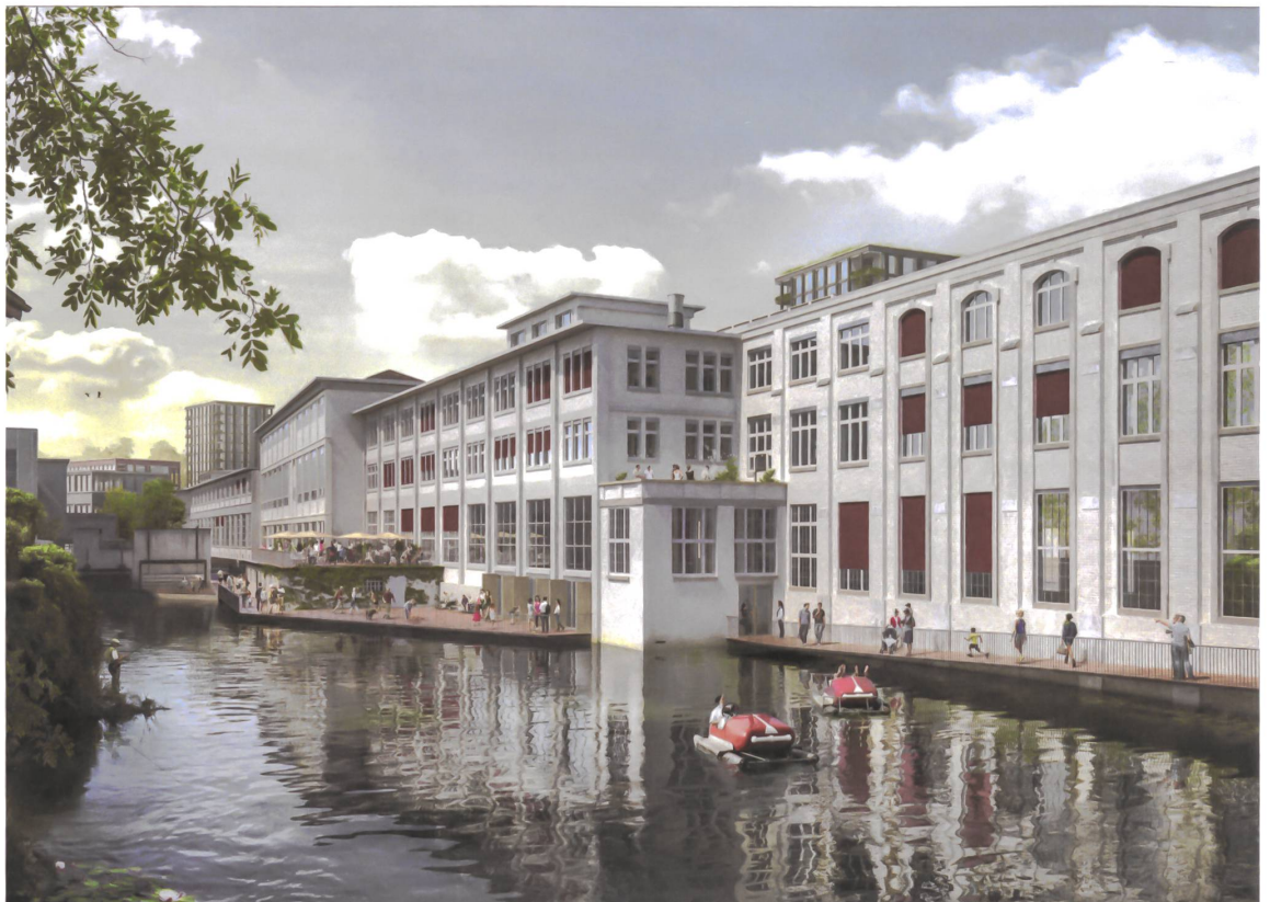
Der Lorzensteg entlang historischer Hallen soll das Areal mit der umliegenden Stadt verbinden.