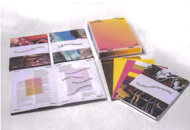
Die Publikation «Kontext Insight» erscheint zweimal jährlich zur «Kontext View» und orientiert sich an erprobten Trendwerkzeugen: Sie fasst die Thesen der Veranstaltung in Text und Bild zusammen und liefert passende Farbkarten. Die Publikation kostet 160 Franken und dient als Instrument für Designerinnen und Designer, die saisonal arbeiten.

Ich fragte mich aus Sicht der Macher, was ich von so einem Nachmittag mitnehmen möchte. Die bisherigen vier saisonalen Veranstaltungen richteten sich an textiles Arbeiten im Bereich Mode. Anstelle davon gibt es nun zwei Veranstaltungen für Designerinnen und Designer aus allen Sparten. An der «Kontext View», die jeweils im Juni und im Dezember stattfindet, halten wir Tendenzen in Farben, Haptiken und Strukturen fest. Dieses saisonale Denken →