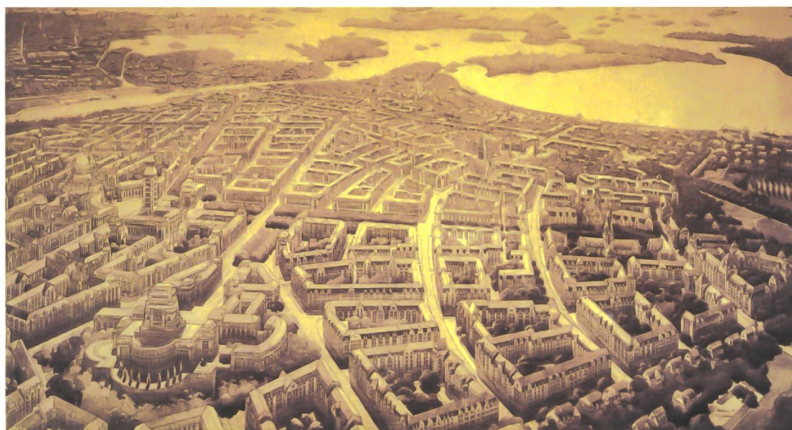
Wie sieht die realisierte Stadt wohl aus? Verkehrsplanungsdiagramm aus den 1960er-Jahren und Vogelschau von Eiel Saarinen für den Vorort Munkkiniemi-Haaga von 1915.

Über den Umweg der Vielfalt der Darstellungsweisen wie Zeichnung, Plan, Perspektive, Skizze, Capriccio, Diagramm, Karte, Fotografie, Film, Modell, Computerdarstellung, Beschreibung, Kritik, Theorie, Geschichte, Buch, Zeitschrift, Ausstellung, Baustatik und Mathematik gerät auch die Architektur wieder neu in den Blick. So lassen sich gerade durch eine genaue Analyse der Wirkungsweisen der architektonischen Medien Rückschlüsse auf das Wesen der Architektur ziehen.