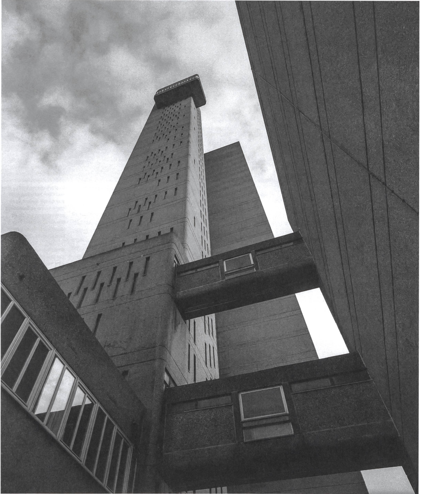
Motiv für Kaffeebecher, T-Shirts und Kissen: Trellick Tower, London, 1969–1972, Ernő Goldfinger.