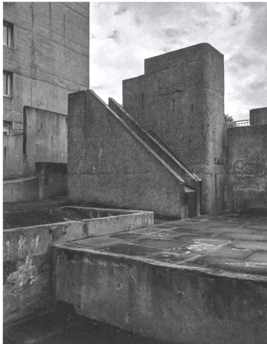
Denkmalgeschützt und bald luxussaniert: Balfron Tower, London, 1965–1967, Ernő Goldfinger.