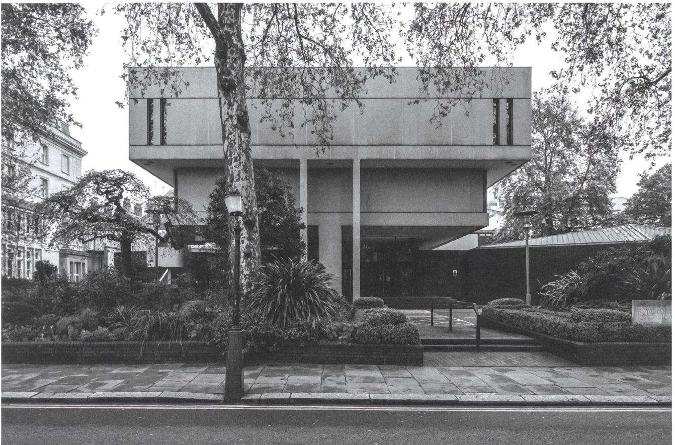
Edel-Brutalismus für ein 500-jähriges Institut: Royal College of Physicians, London, 1959–1964, Denys Lasdun.