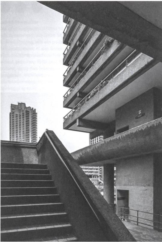
Stadt in der Stadt: Barbican Estate, London, 1965–1976, Chamberlin, Powel and Bon.