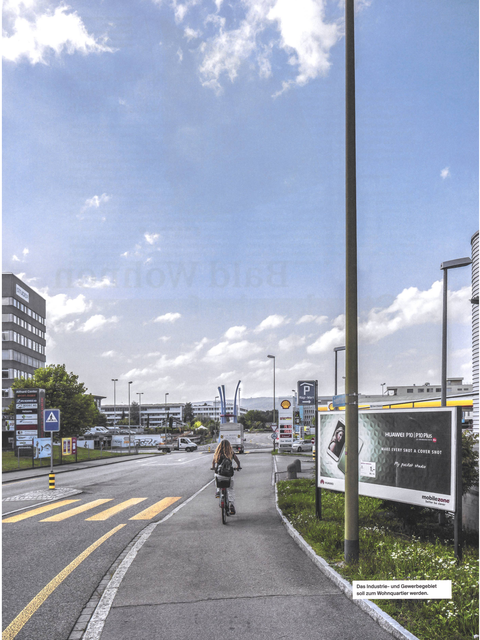
Das Industrie- und Gewerbegebiet soll zum Wohnquartier werden.