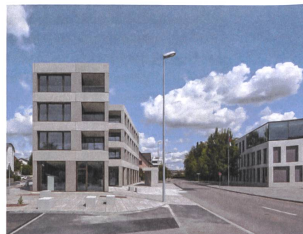
12 Neubau Bibliothek und Wohnungen, 2017