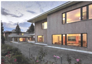
9 Vierfachkindergarten Roos, 2016