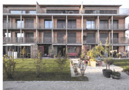
8 Wohnsiedlung Sunny Watt, 2010