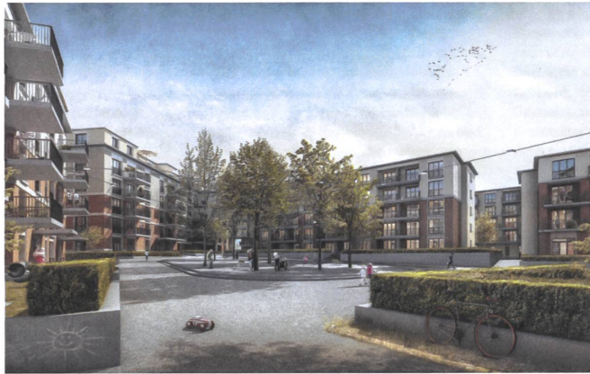
17 Wohnüberbauung Stockenhof, 2022 Visualisierung: Renderisch

16 Waveup, 2020 Neben der Sportanlage Wisacher plant der Verein Waveup einen 155 Meter langen See. Seine künstlich produzierten Wellen sollen den Surfern dienen, Badegäste sollen sich am Strand entspannen. Büro, Restaurant, Garderoben, Surfschule und Shops finden in den zwei Gebäuden beim Eingang Platz. In den kleinen Pavillons können Touristen übernachten. Adresse: Wiesackerstrasse 30 Bauherrschaft: Waveup Verein, Zürich Architektur: Carint Berke Architekten, Zürich