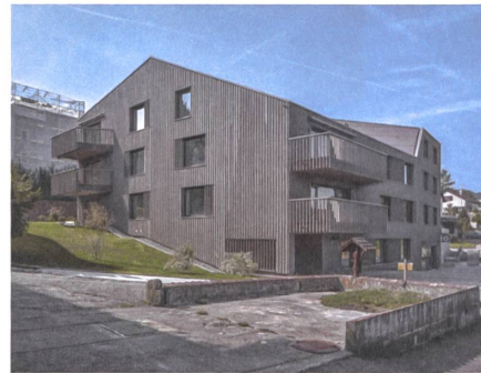
1 Wohnüberbauung Sagi, 2016

Das Projekt für das 36 000 Quadratmeter grosse Areal umfasst mehr als 600 Wohnungen. Es sieht aufgebrochene Blockränder vor, aus denen zwei Hochhäuser wachsen. Insgesamt sollen in zwei Etappen fast 70 000 Quadratmeter Wohn-, Dienstleistungs- und Gewerbeflächen entstehen. Adresse: Althardstrasse / Neuhardstrasse / Wehntalerstrasse Bauherrschaft: Pensimo Gruppe, Zürich Richtprojekt: ADP Architekten, Zürich Auftragsart: eingeladener Wettbewerb, 2014 (durchgeführt von vormaliger Eigentümerin)