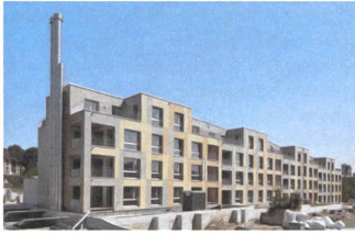
2 Mehrfamilienhaus Balance, 2016