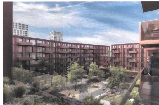
19 Wohn- und Gewerbehaus Althardstrasse, 2021