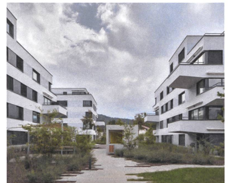
11 Wohnsiedlung Sonnenhof, 2015