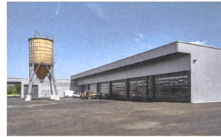
4 Werkhof, 2016