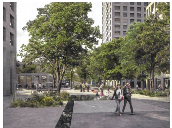
14 Gretag-Areal, in Planung