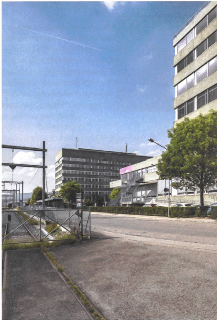
15 Areal Bahnhof Nord, 2040