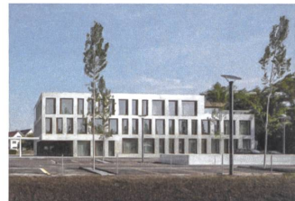
5 Erweiterung Gemeindehaus, 2016