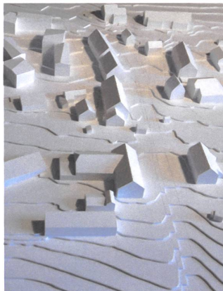
18 Arealüberbauung Gheidstrasse, in Planung

17 Wohnüberbauung Stockenhof, 2022 Auf dem 30 000 Quadratmeter grossen Areal zwischen Bahnhof, Justizvollzugsanstalt und Einkaufszentrum will die BVK rund 380 Wohnungen bauen. Der bewilligte Gestaltungsplan sieht ein fünfstöckiges Ensemble vor, bestehend aus drei Einzelhäusern, drei kurzen Riegeln und zwei langen Randbebauungen. Sie sollen die inneren Häuser vor dem Strassenlärm abschirmen. Zwischen den Gebäuden wird ein grosszügiger, öffentlicher Freiraum mit einem Quartierplatz als Herzstück und Begegnungsort entstehen. Bauherrschaft: BVK, Zürich Generalplaner: Mettler2 Invest, Zürich Architektur: Dachtler Partner, Zürich Städtebau: Demuth Hagenmüller & Lamprecht Architekten, Zürich