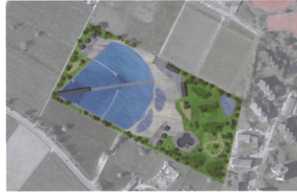
16 Waveup, 2020 Plan: Waveup / Carint Berke Architekten

15 Areal Bahnhof Nord, 2040 Das 21,5 Hektaren grosse Industrie- und Gewerbeareal nördlich des Bahnhofs Regensdorf-Watt ist eines der grössten Entwicklungsgebiete im Kanton Zürich. Der Masterplan sieht die Aufteilung in 17 Baufelder rund um eine grosszügige, zentrale Freiraumachse vor. Diese wird nur dem öffentlichen und dem Langsamverkehr vorbehalten sein und die beiden Stadtwäldchen Hardholz und Schlatt miteinander verbinden. Städtebauliche Entwicklungsstudie: Dürig Architekten, Topotek 1 Landschaftsarchitekten, Willi Hüsler Verkehrsplanung Bauherr: 15 private Grundeigentümer, Gemeinde Regensdorf, Ausnützungsziffer: 2.3 Planungshorizont: 2040