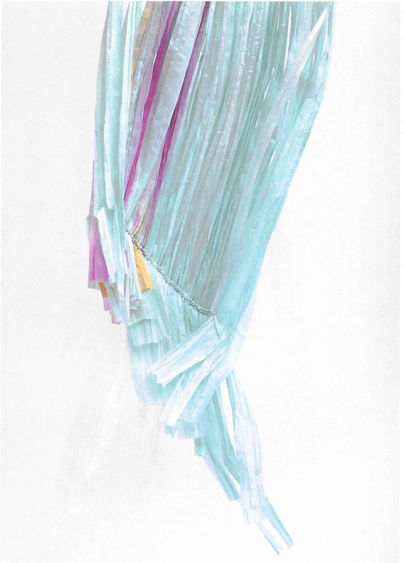
Papier, Bast und Plastik mit einer Maschenreihe verstrickt.