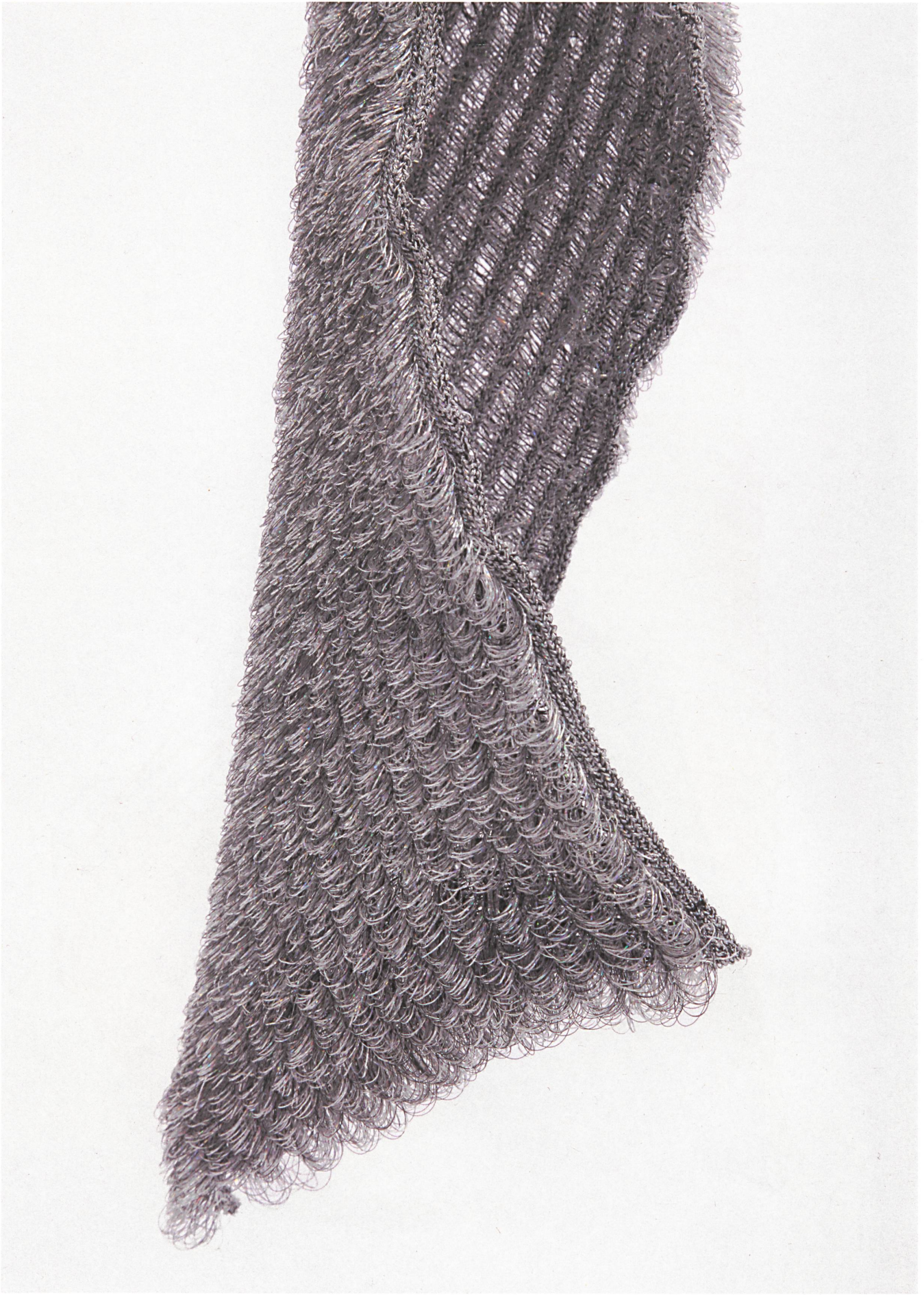
Lurex, Nylon und Lycra.