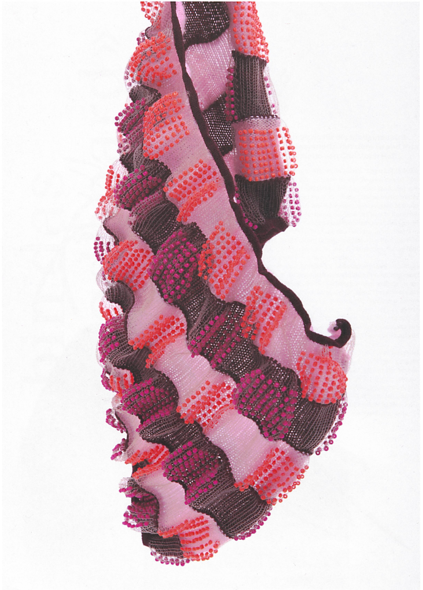
Doppellagiger Strick. Cashwool Nylon und Lycra mit integriertem Perlenmuster.